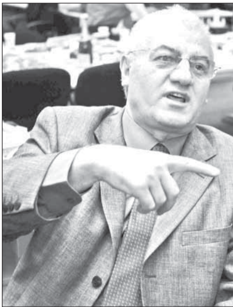
Dumitru Dragomir și Gigi Becali se ceartă din cauza banilor

Președintele LFP, Dumitru Dragomir, a declarat, luni, că Adunarea Generală a aprobat vânzarea celor șase pachete disponibile de meciuri, pentru următoarele trei sezoane, către RCS&RDS, precizând că drepturile TV ale partidelor din Liga 1 au fost cedate pentru o sumă totală de peste 100 de milioane de euro (incluzând TVA). Compania RCS&RDS a achiziționat șapte pachete de