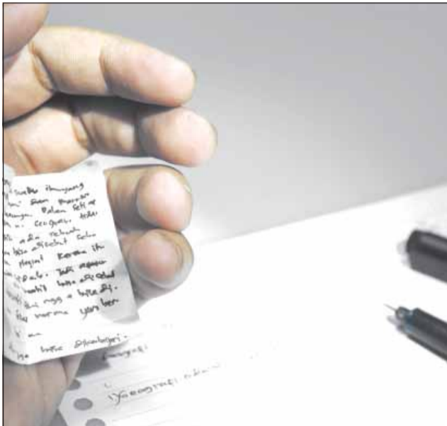
Copiatul a devenit un fapt banal astfel încât nu mai există nici sentimentul de culpabilitate care se asociază cu copiatul, arată un sondaj recent în rândul elevilor clujeni