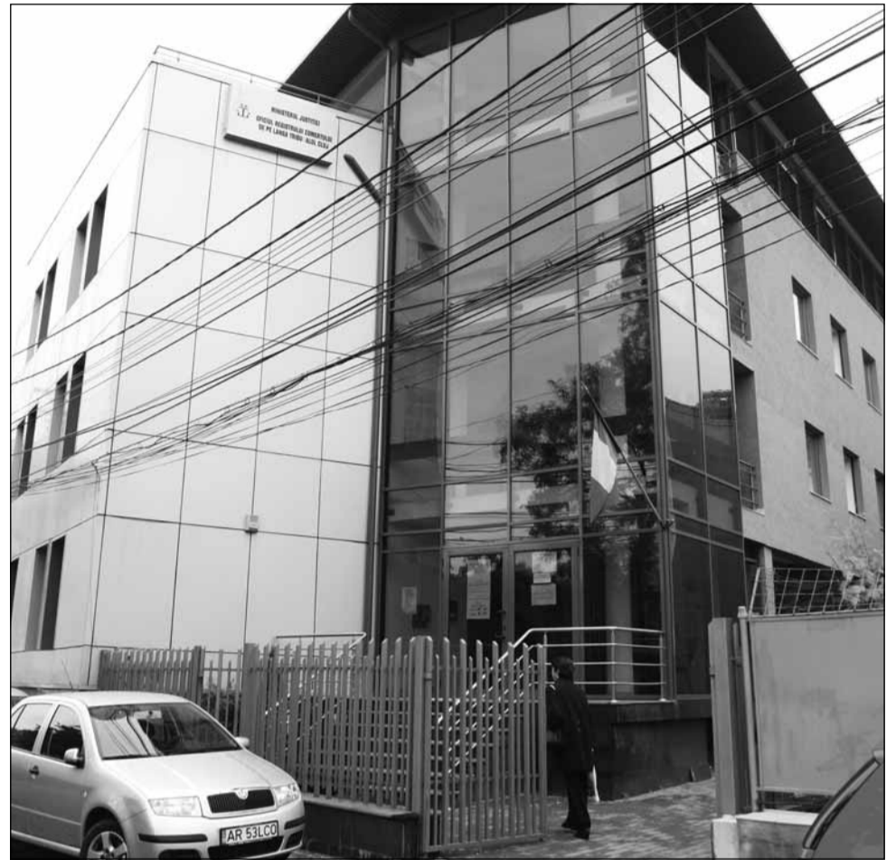
Sediul Registrului Comerțului Cluj

Cele mai multe societăți care s-au confruntat cu dificultăți financiare sunt în continuare cele din domeniul comerțului, 725 intrând în insolvență, dar și cele din industria prelucrătoare - 349 și construcții - 291.