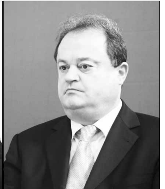
Crin Antonescu, Victor Ponta și Vasile Blaga sunt primii trei politicieni în topul preferințelor românilor