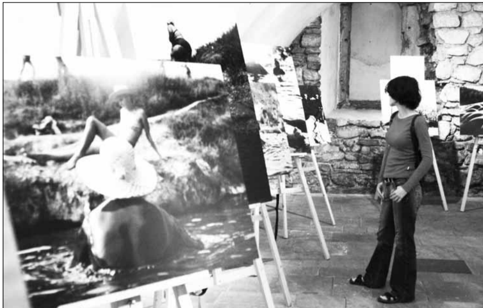
Printre avantajele Clujului în cursa pentru titlul de Capitală Culturală Europeană se numără și organizarea TIFF și a altor evenimente culturale în spații neconvenționale

În același timp, planificarea programelor, prin cele șapte comisii sectoriale constituite la nivelul Asociației Cluj-Napoca 2020 Capitală Culturală Europeană, care are persona-