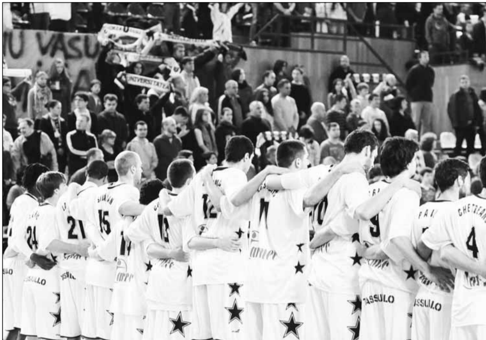
Campionii vor avea un meci greu în această seară

„U” Mobitelco BT va juca în această seară un nou meci în EuroChallenge Cup. Clujenii evoluează din nou în deplasare, acesta fiind cel de al patrulea meci din cadrul grupei E a competiției europene. În meciul tur, disputat la Sala Sporturilor „Horia Demian”, francezii s-au impus cu 85-81, după un meci spectaculos, în care campionii României au fost aproape de a se impune. Aceștia au fost apoi depășiți destul de clar în deplasare de Antwerp Giants, 63-87, dar au reușit să învingă pe Enisey Krasnoyarsk, chiar pe terenul acesteia, cu 81-73. După victoria din Rusia, campionii au defilat și în campionat, unde au trecut pe