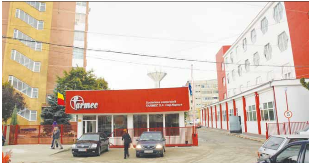
La nivel național, jumătate dintre managerii companiilor au afirmat că s-au folosit de rețelele sociale pentru a atrage noi clienți în 2011.

„Varietatea subiectelor puse în discuție în fiecare zi, conținutul furnizat pe această pagină, dar și răspunsurile prompte la întrebările venite din partea fanilor noștri