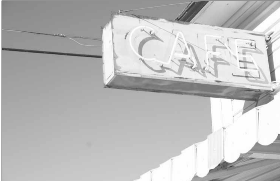
Consultanții cred că industria serviciilor este cea mai profitabilă în această perioadă de criză

„Prima opțiune, având în vedere că sunt bancher ar fi să