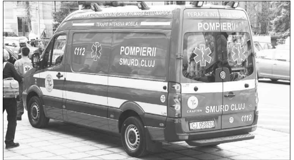
Medicii de la Ambulanță au intervenit în zilele de Crăciun inclusiv în cazul unor tineri de 13-14 ani ajunși în comă alcoolică

„În Ajunul Crăciunului au predominat mai mult stările de ebrietate, mulți fiind tineri. Am avut aproximativ 15 astfel de solicitări, din toate orașele din județ. Am avut și câteva come alcoolice la minori cu vârsta de 13, 14 și 16 ani. Un astfel de caz a fost în Bonțida”, a afirmat Horia Simu.