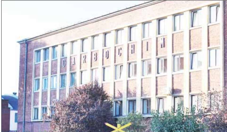
Majorarea pachetului de acțiuni deținut de Electroargeș la compania Carbochim au determinat o creștere conjuncturală a valorii acțiunilor celei din urmă.

Situația e regăsită și în cazul S.S.I.F. Broker. Cu variații mai mici de preț, titlurile companiei s-au depreciat puternic, de la 0,24 lei, cu cât se putea cumpăra o acțiune la începutul anului, la 0,10 lei la sfârșitul celor 12 luni ale lui 2011.