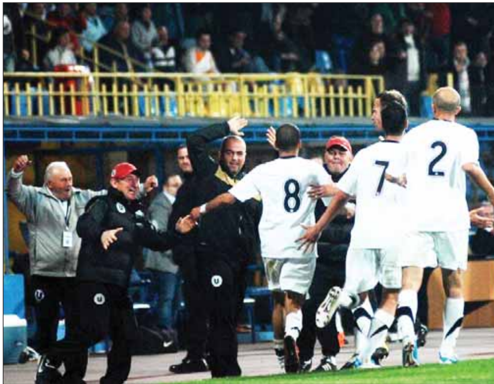
„Studenții”, bucurându-se după victoria cu Dinamo din returul sezonului trecut