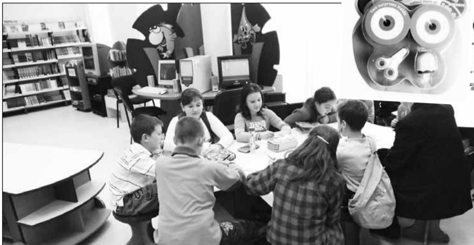
Comisariatul Județean pentru Protecția Consumatorului Cluj nu poate retrage de pe piață radierile „Zgumee”, dar le recomandă părinților să nu cumpere astfel de produse

Ulterior notificării, Comisia Europeană a dispus suspendarea acesteia, până la lă-