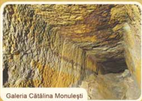
Galeria Cătălina Monulești

Cu una dintre cele mai mari investiții private din România în domeniul culturii, generațiile viitoare vor putea vedea cum 2000 de ani de minerit au construit Roșia Montană.