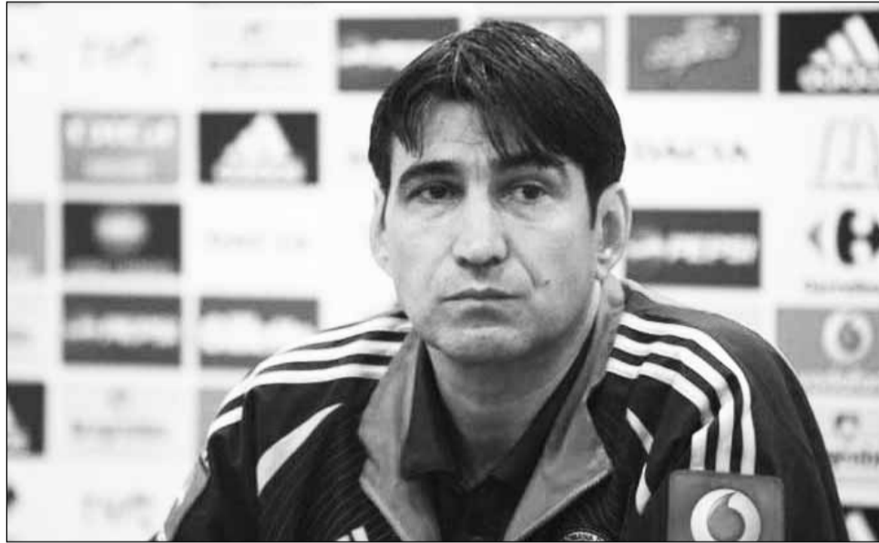
Victor Pițurcă așteaptă să vadă adversarele României din preliminariile CM 2014

Urna 3: Elveția, Israel, Irlanda, Belgia, Cehia, Bosnia - Herțegovina, Belarus, Ucraina, Ungaria.