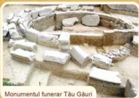
Monumentul funerar Tău Găuri