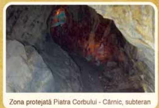
Zona protejată Piatra Corbului - Cărnic, subteran

Proiectul Roșia Montană. Aur pentru România.