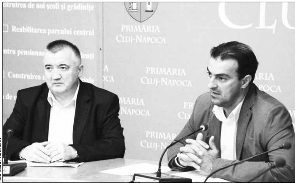
Primarul Sorin Apostu a explicat ieri de ce susține transportul cu tramvaiul: „Este considerat astăzi cel mai verde mijloc de transport din lume”, confortabil și silențios și, mai ales, rapid.

Noile garnituri de tramvai ar putea intra în circulație din primăvara anului viitor, odată cu finalizarea lucrărilor la linia de tramvai pe tronsonul Mănăștur – Gară. Practic, odată cu modernizarea liniei de tramvai și introducerea noilor tramvaie, viteza de transport va crește, iar timpul parcurs pe traseul Mănăștur – Gară va scădea de la 40 la 20 de minute. Practic, la fiecare 6,5 minute un tramvai va trece prin stație.