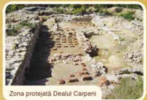
Zona protejată Dealul Carpeni

Galerii miniere din toate epocile istorice, descoperiri arheologice și zeci de clădiri-monument din localitate vor fi restaurate și puse în valoare de RMGC.