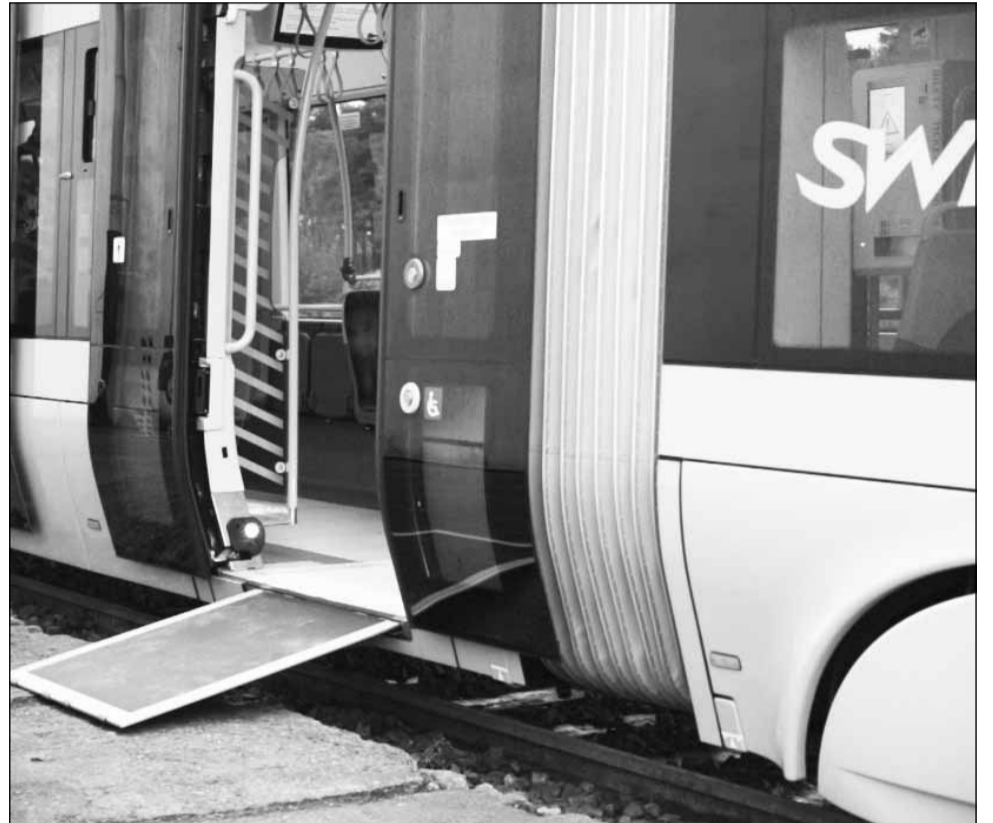
Astfel arată tramvaiele fabricate de polonezi. Cele destinate Clujului vor fi vopsite în mov și gri.

PESA este una dintre cele mai vechi companii din