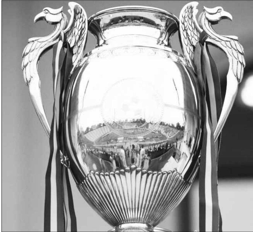
Opt echipe vor mai rămâne în cursa pentru Cupa României

Poli și Steaua s-au întâlnit ultima dată în Cupa României în sezonul 2006-07. Bănăneții s-au impus atunci în semifinala jucată de stadionul Giulești din Capitală, dar au pierdut în fața Rapidului finala jucată pe propriul teren. Partida Poli Timișoara – Steaua este programată de la ora 20.45, pe stadionul „Dan Păltinișanu” și va fi arbitrată de Cristian Balaj (central), Eduard Dumitrescu și Miclos Nagy (tusieri) și