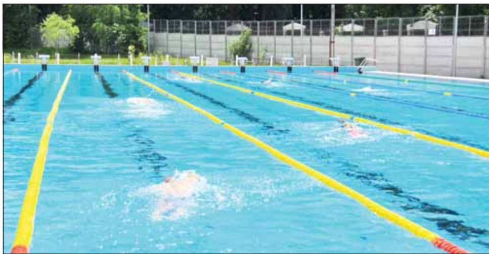
Programul Jocurilor Regionale va include competiții de înot asistat și înot liber

La eveniment și-au anunțat prezența 210 participanți, dintre care 140 sunt sportivi cu dizabilități intelectuale, iar restul antrenori, profesori și părinți, din Arad, Bihor, Ca-