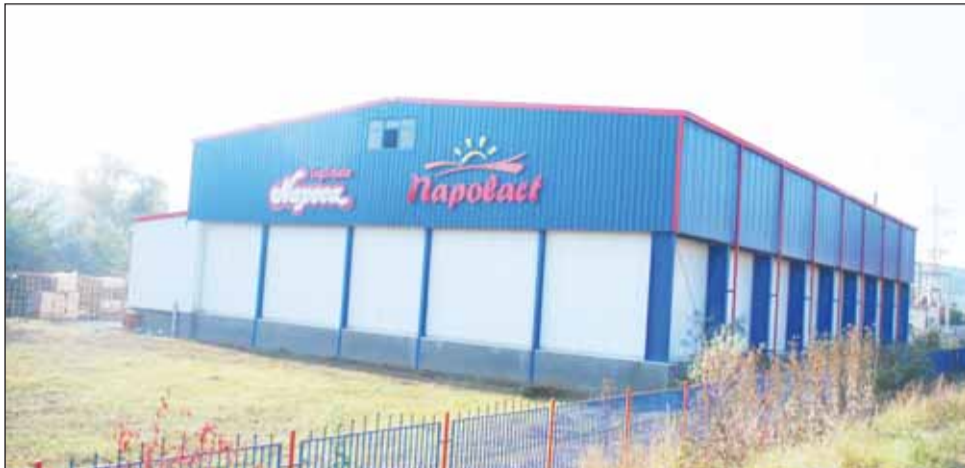
Scăderea numărului de bovine a făcut ca procesatorii de lapte să aibă probleme la preluare, din cauza cantităților mici

„90% din laptele procesat de noi e din județ, de la procesa-