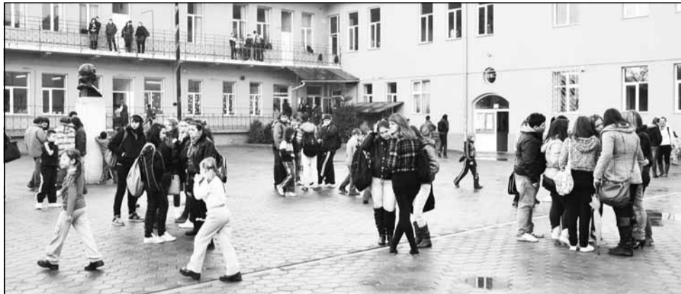
Jumătate din elevii clujeni suferă de o boală cronică, dar medicii spun că situația nu este atât de rea precum pare, deoarece nu sunt afecțiuni grave iar majoritatea se pot corecta

Pe locul doi se află viciile de postură sau deformațiile coloanei. Un număr de 3.759 elevi suferă de o astfel de afecțiune cro-