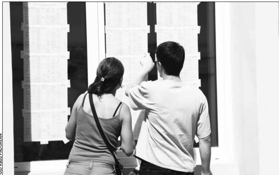
Tinerii care nu și-au luat BAC-ul în vară pot opta pentru o serie de meserii care nu necesită diplomă sau se pot înregistra pentru indemnizația de șomaj

O a doua variantă de angajare pentru care diploma de bacalaureat nu contează, dar care presupune cursuri în dome-