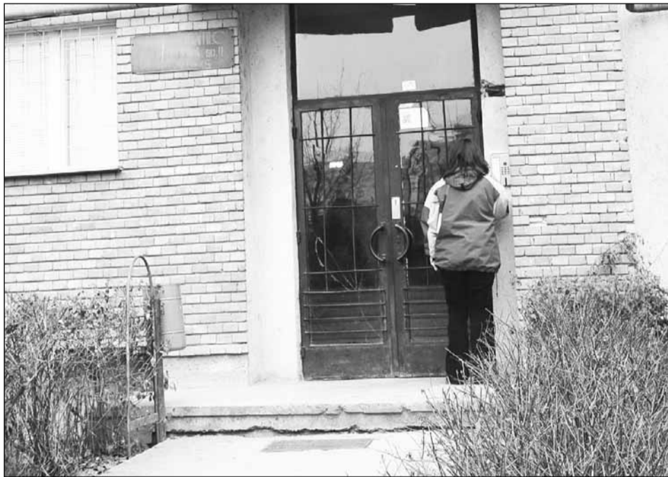
Studentii încep de luna aceasta să-și caute din nou chirii, spre bucuria proprietarilor