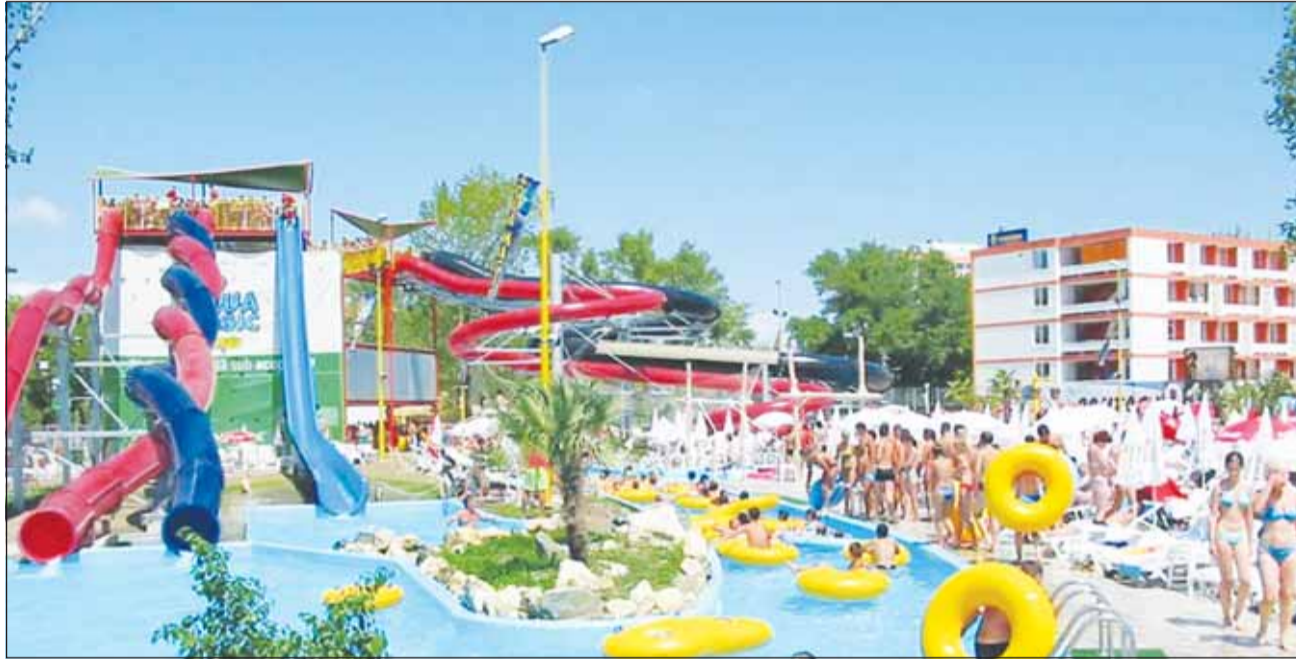
Primăria speră ca de data aceasta să apară un investitor interesat de ridicarea aqua-park-ului de pe Bulevardul 1 Decembrie 1918

Contractul de concesiune lucrări publice pentru realizarea și exploatarea unui complex de tip aquapark pe Bulevardul 1 Decembrie 1918, pe amplasamentul actualului strand „Sun”, va fi licitat în data de 8 septembrie. Valoarea investiției se ridică la circa 10 milioane de euro. Primăria a ales procedura dialogului competitiv, care cuprinde mai multe etape. Astfel, la preselecție poate participa orice operator economic care și-a depus oferta. Candidații declarați calificați