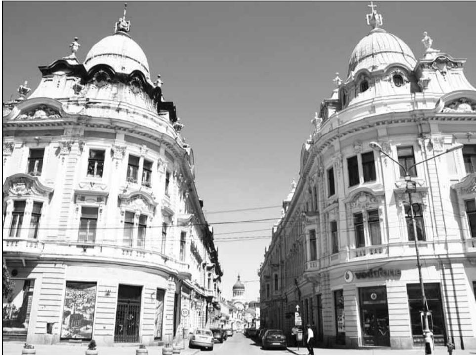
Una dintre clădirile gemene ale Clujului se va transforma într-un restaurant de tip fast-food

Valoarea chiriilor ce urmează să fie plătite Primăriei pentru spațiile licitate este cuprinsă între 35 lei/mp/lună și 88 lei/mp/lună. Cea mai ma-