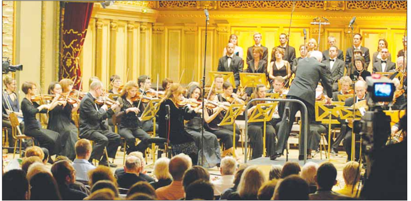
Festivalul „George Enescu” are o nouă identitate de brand odată cu ediția din acest an

Seria “Mari orchestre ale lumii” înseamnă totodată și mari dirijori ai lumii, precum și mari soliști ai lumii. Numele răsunătoare de pe afiș, orchestrele cu renume de „ansambluri-ceas” pentru finețea și exactitatea cu care prezintă muzica pe scenă aduc în sală mii de spectatori. Seria “Recitaluri și concerte camerale” – diversitatea este tradusă aici prin vitalitate. Seria “Concertele de la miezul nopții”, care până acum deschideau porțile spre vremuri baroce, vor reuși de această dată arii vechi. Seria “Word Music” este nou-