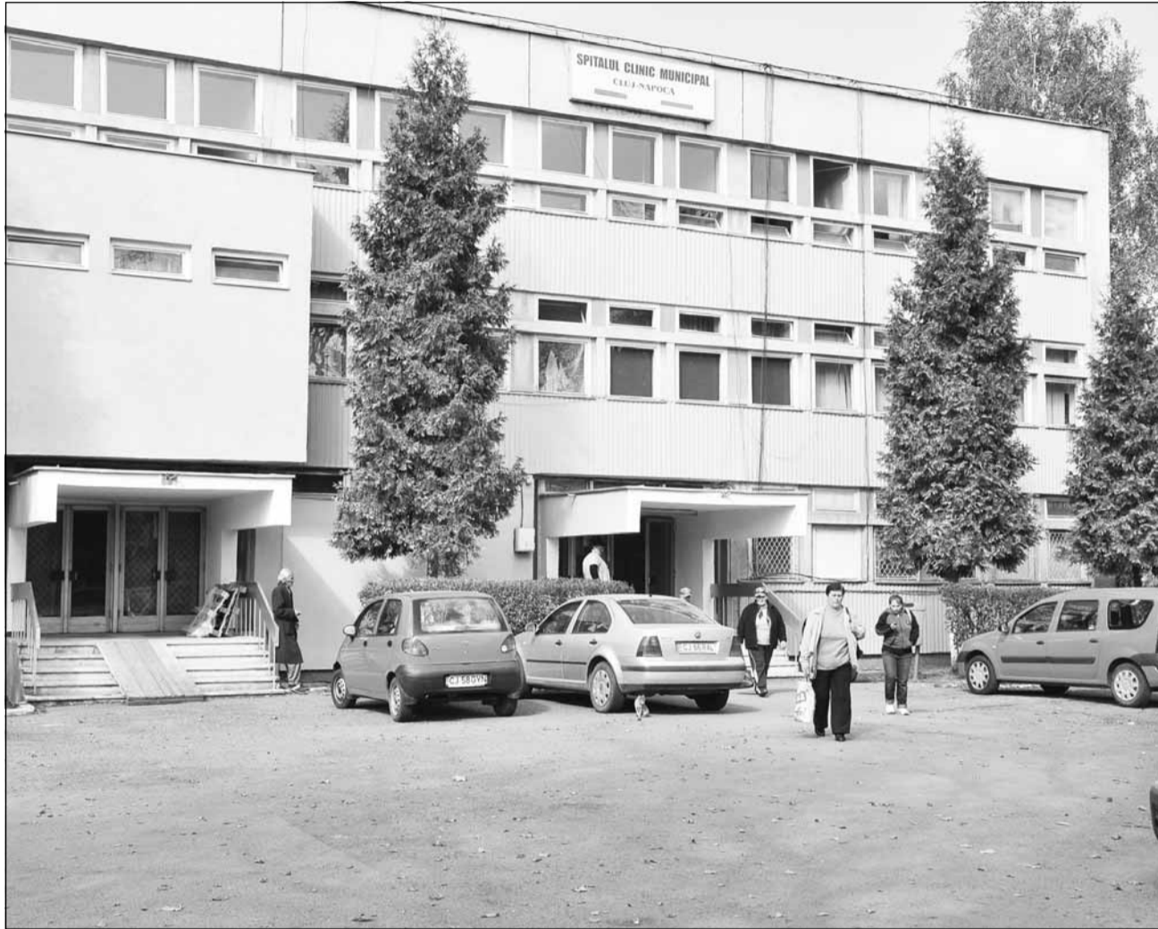
Finanțarea primită de Spitalul Municipal de la CAS, de aproape 21 de milioane de lei, s-a dus în cea mai mare parte – peste 16 milioane – pentru salariile personalului.

Potrivit documentului citat, finanțarea de la CAS a