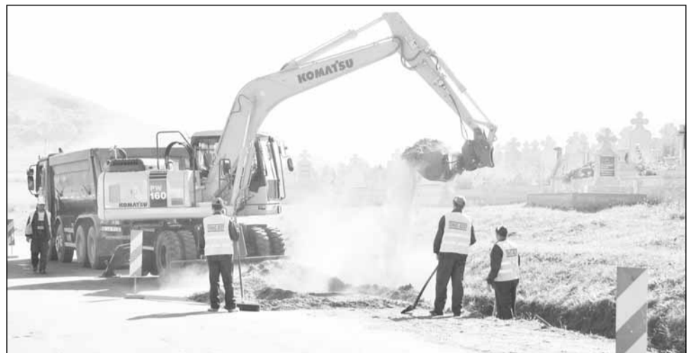
După ce în septembrie au început lucrările de modernizare pe 5 tronșoane de drumuri județene, în curând ar putea demara lucrările pentru următorii 317 km, a anunțat vicepreședintele Consiliului Județean, Radu Bica

Valoarea maximă estimată pentru proiectarea și execuția lucrărilor este de 311,3 milioane de lei fără TVA, respectiv 73.541.441 de euro fără TVA. Valorile maxime ale proiectării și lucrărilor executate estimate pe fiecare lot sunt (fără TVA): lot 1 – 71,5 milioane de lei, lot 2 – 78,1 milioane de lei, lot 3 – 70,8 milioane de lei și lot 4 – 90,8 milioane de lei.