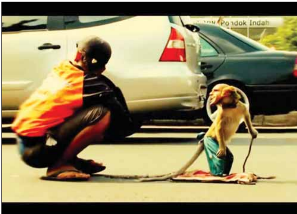
Secvență din filmul „Life in a Day” (O zi din viață), care va rula joi la Cinema Victoria în deschiderea Cinematecii TIFF

Deschiderea Cinematecii TIFF va avea loc joi, 27 octo-