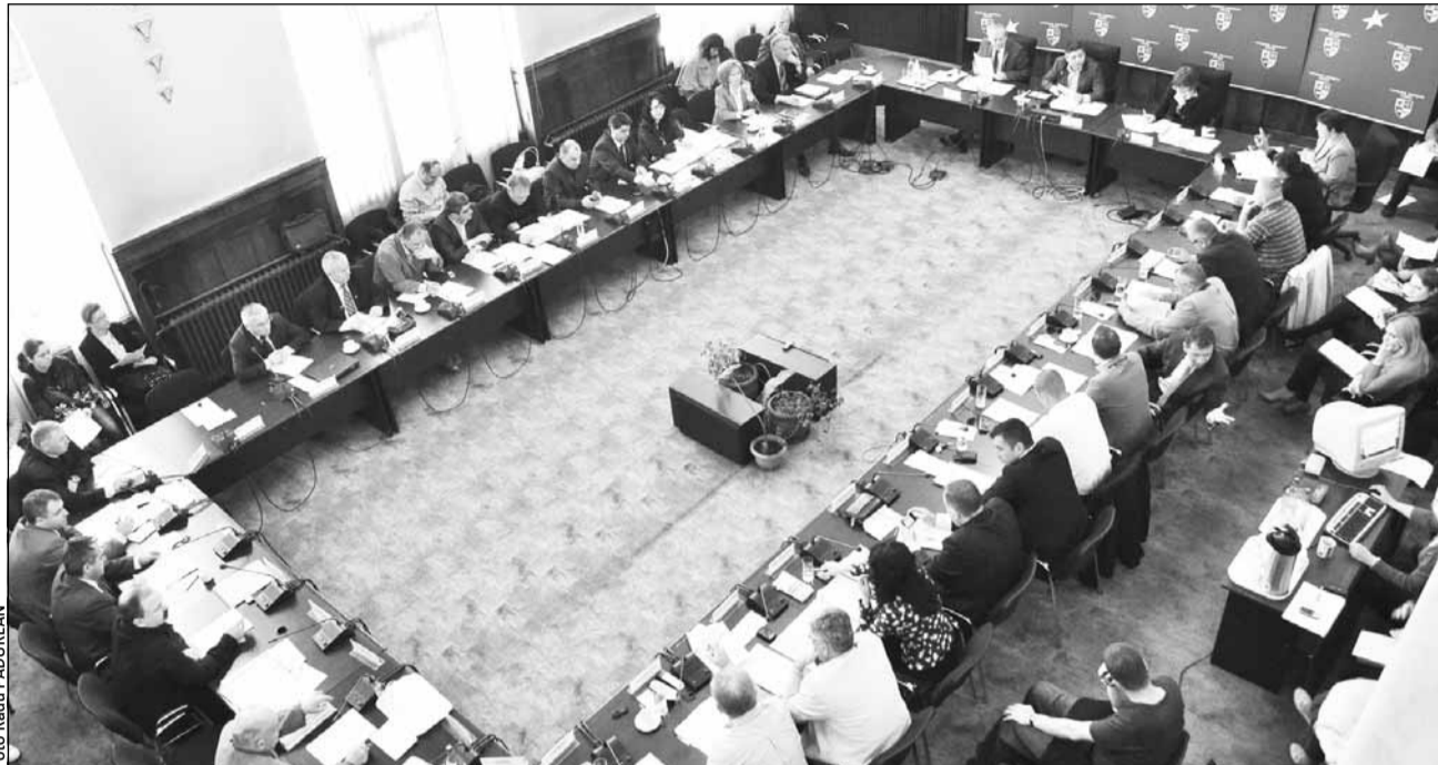
Noul stadion „Cluj Arena” a fost subiectul principal al discuțiilor dintre consilierii județeni

„Doresc să retrag acest punct de pe ordinea de zi până vom primi un răspuns oficial de la Direcția Finanelor cu privire la plata TVA-ului. Dacă înființăm societatea acum, riscăm să plătim TVA pentru această construcție”, a motivat Tișe. Vă reamintim că, potrivit proiectului retras de Tișe, acționarii „Cluj Arena” SA ar fi trebuit să fie județul Cluj, prin Consiliul Județean Cluj, cu o cotă de participare la capitalul social de 90% și Regia Autonomă de Administrare a Domeniului Public și Privat (RAADPP) al județului Cluj, prin directorul general, cu o cotă de