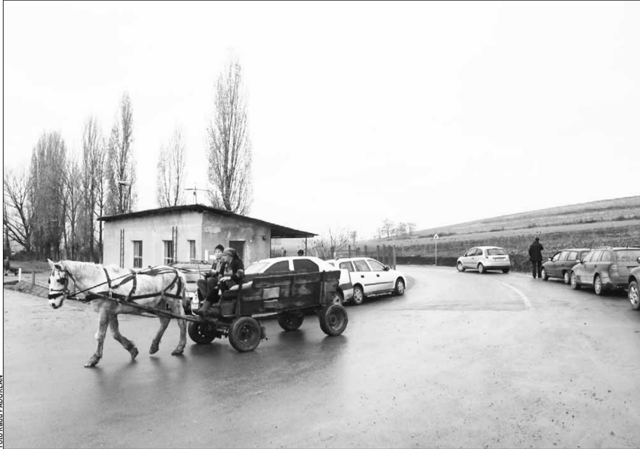
Consilierii județeni au aprobat noul proiect privind reabilitarea drumurilor județene în perioada 2011-2015, prin care alți 317 km de drumuri județene vor fi modernizați

Valoarea noului proiect este estimată la 434,9 milioane de lei. "Scopul adoptării prezentei hotărâri îl constituie actualizarea programului de reabilitare a drumurilor județene, respectiv etapizarea acestuia, astfel că actualmente, într-o prima etapă, se află în evaluare ofertele depuse la procedura de achiziție publică – licitație deschisă, pe 5 loturi, având drept criteriu de atribuire prețul cel mai scăzut, în vederea reabilitării și modernizării primelor tronsoane de drumuri județene, urmând ca în etapa a II a să se demareze procedura de achiziție publică pentru restul lucrărilor rămase a fi executate, în vederea modernizării