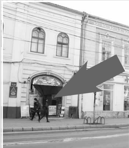
Studio Foto Best Media Factor, str. Memorandumului nr. 23, etaj I, ap. 10