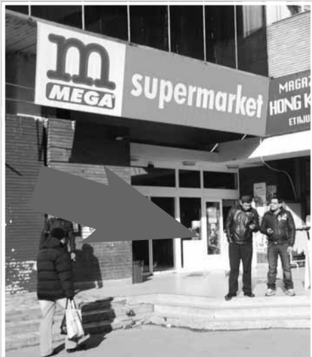
Magazin Mega SuperMarket, Hala Agroalimentară