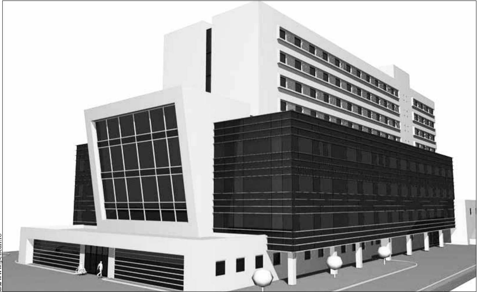
Macheta viitorului spital Pelican

Dacă sistemul public de sănătate a rămas fără un spital, în domeniul privat au fost deschise anul trecut două clinici în care s-au investit sume importante. Prima este Centrul Medical Transilvania, deschis în cartierul