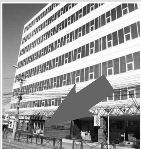
Redacția Monitorul de Cluj SIGMA Business Center Cluj-Napoca, str. Republicii nr. 109, etaj I