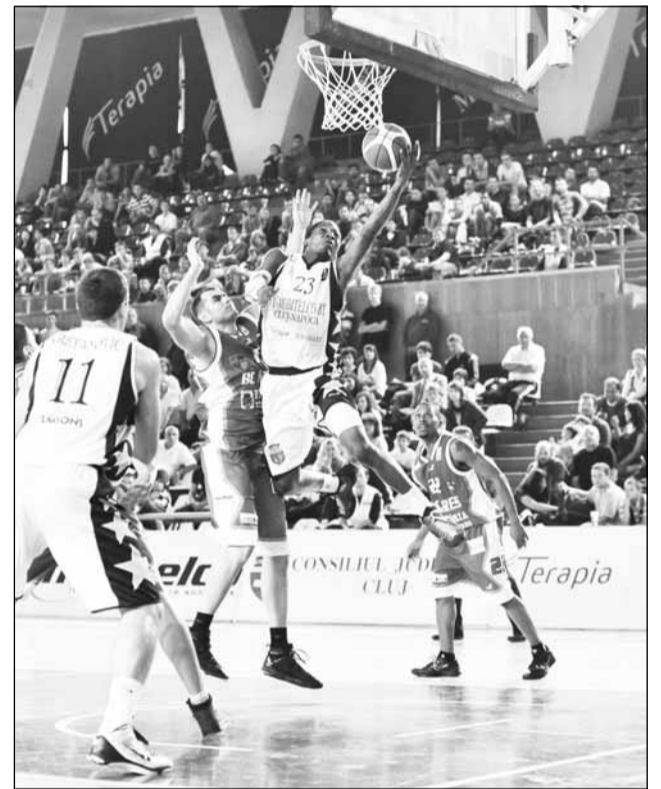
Campionii vor juca două meciuri în 4 zile