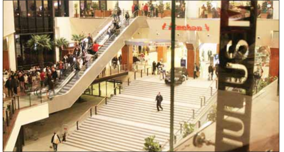
14,7 milioane de vizitatori au trecut în 2011 pragul Iulius Mall