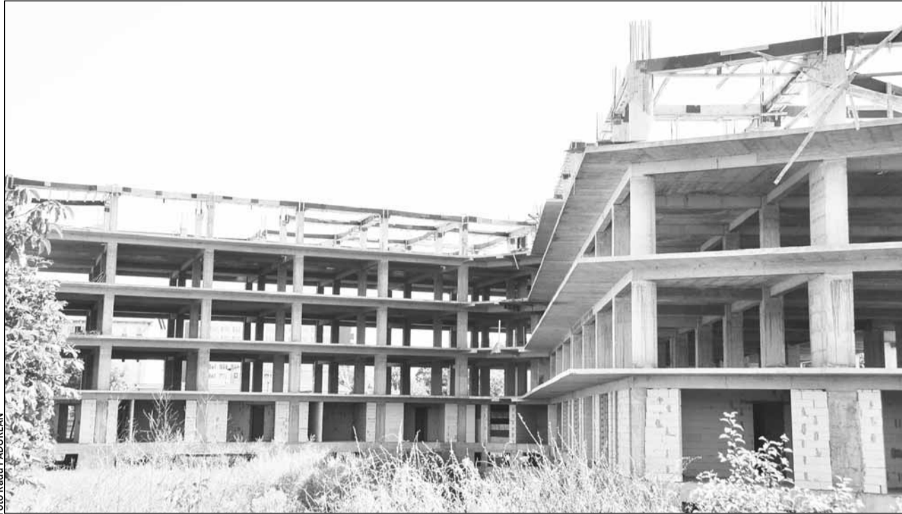
Aici trebuia să fie un complex rezidențial cu apartamente și spații comerciale