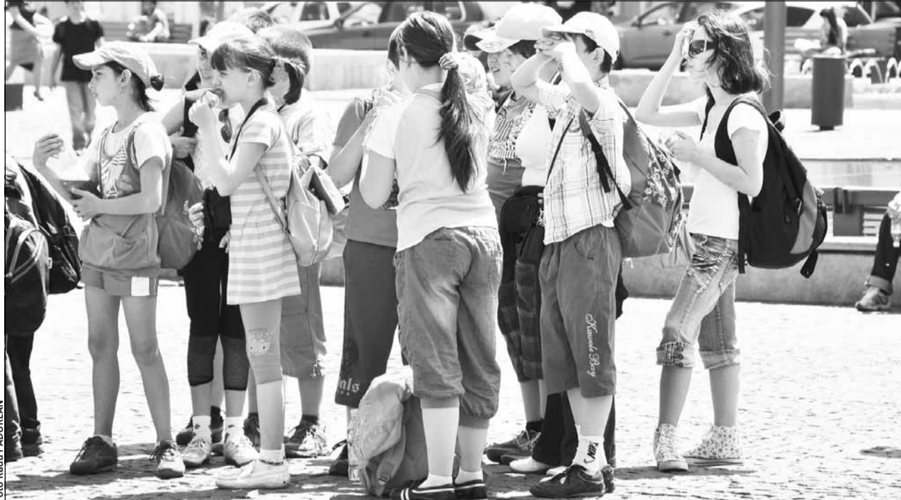
Elevii vor reveni în bănci pe 12 septembrie, structura anului școlar fiind deja aprobată

Potrivit ministrului, un pas extrem de important în evoluția sistemului de învă-