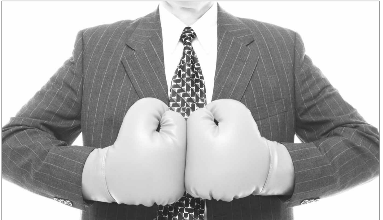
Tinerii clujeni sunt hotărâți să dea un suflu nou mediului de afaceri clujean, destul de îmbătrânit

Fără bani, degeaba ai idei. Atragerea de fonduri nerambursabile reprezintă o ocazie de neratat pentru tinerii care nu au sprijinul financiar al familiei. „Marea problemă