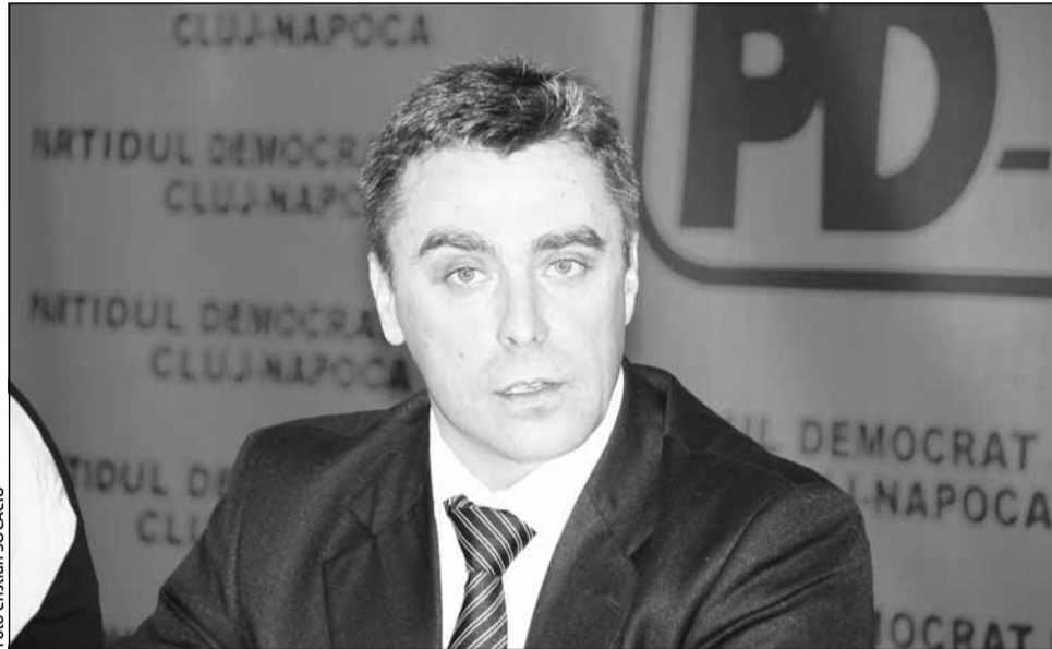
Mesteșugarii sunt mai puțin îndemânatici cu banii

Cea de-a doua etapă vine cu finanțarea celor mai bune Planuri de Afaceri, valoarea alocației financiare nerambursabile fiind de maxim 70% din valoarea cheltuielilor eligibile aferente proiectului, dar nu mai mult de 100.000 lei/beneficiar.