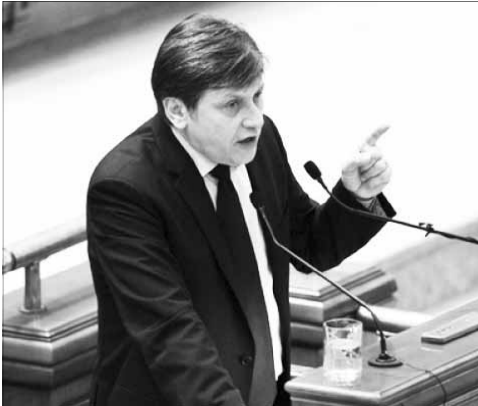
O imagine rară: Crin Antonescu în Parlament

Fără să fi fost în grevă, liderul PNL Crin Antonescu nu are nicio prezentă la voturile finale exprimate prin vot electronic în sesiunea septembrie – decembrie 2011, arată un stu-