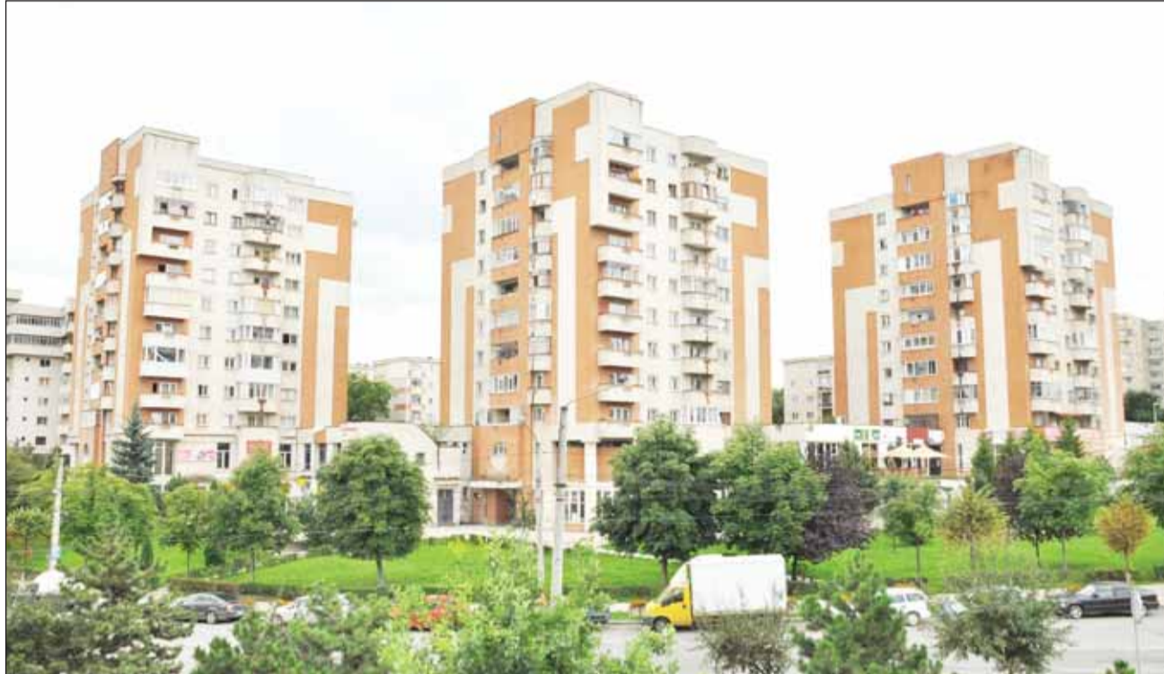
Clujenii au preferat anul acesta să închirieze și nu s-au mai uitat atât de mult la ofertele de vânzare a apartamentelor

Creșterea interesului pentru închiriere și în același timp concretizarea acestuia este confirmată și pe plan local de agenții imobiliare. „Cererea de apartamente s-a menținut la același nivel față de anul trecut, iar prețul a rămas relativ constant, înregistrându-se variații