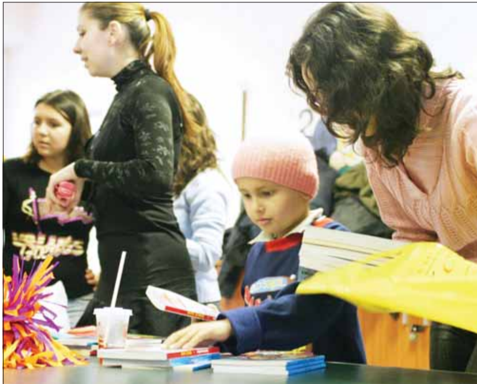
Copiii își pot vinde sâmbătă o parte din jucăriile de care s-au plictisit, în cadrul unui târg de Moș Nicolae, putând dona 50% din sumele astfel obținute pentru cauze caritabile

Din sumele obținute, copiii clujeni vor putea dona 50% pentru cauze caritabile, la alegerea lor. Astfel, banii pot ajunge la copiii care suferă de boli grave sau la cei mai puțin favorizați de soartă, pentru care comunitatea poate să joace rolul lui Moșului. Târgul va avea loc în incinta Iulius Mall, în zona intrării principale, între orele 11.00 și 16.00. Pentru a putea participa la acest eveniment, copiii trebuie să se înscrie trimițând un mesaj la adresa de e-mail office@scoalainternationala.ro. Elevii clujeni se pot înscrie atât în grup, cu ajutorul educatoarelor sau învățătoarelor, cât și individual, cu ajutorul părinților, până la data de 25 noiembrie, ora 15.00. În ceea ce privește cauzele caritabile către care vor fi direcționați 50% din banii obținuți din vânzarea decorațiilor sau a jucăriilor, acestea pot fi decise fie de către fiecare grup în parte, fie se pot alege dintre ca-