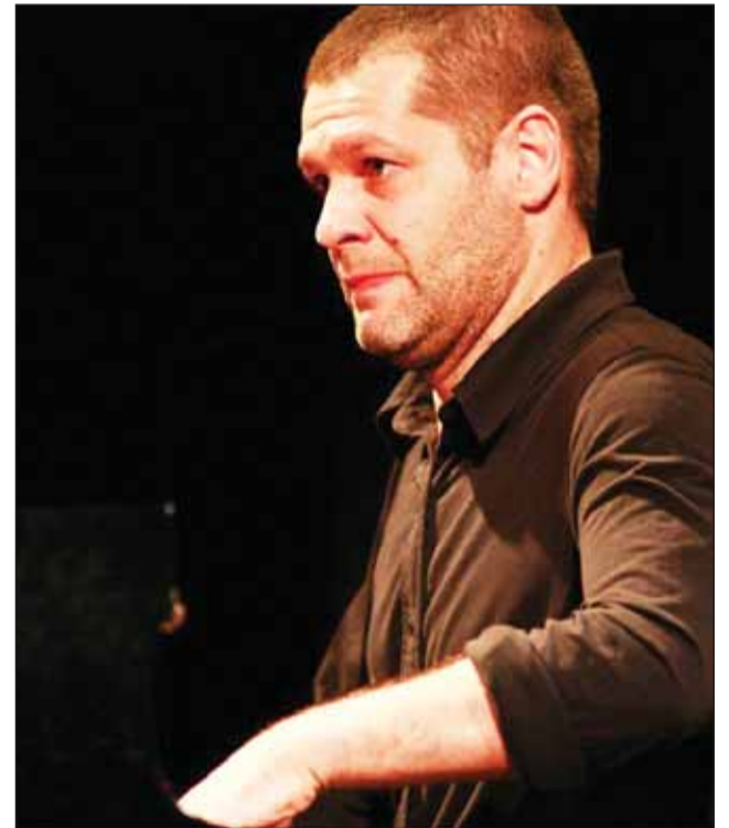
Renumitul pianist Lucian Ban va cânta în decembrie la Cluj-Napoca, alături de saxofonistul Sam Newsome

Combinând muzica folk românească cu jazzul american, proiectul reprezintă perspectiva atât a unui cântăreț de jazz american care explorează muzica folk românească, cât și a unui cântăreț român de jazz care reinvesti-