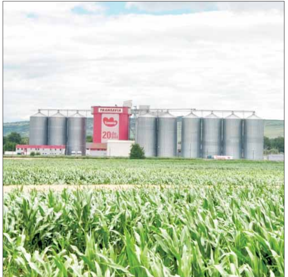
Investiția Transavia este o premieră, pentru că niciun alt crescător român de păsări nu cultivă cerealele pentru hrana acestora

Sume importante au fost alocate de către firma din Alba și pentru modernizarea fabricii de procesare, nu atât pentru creșterea capacității de producție, cât pentru a lărgi gama de produse, mai cu seamă cu cele destinate exportului pe continentul african. Pe lista de investiții din acest an se află și abatorul, vehiculele care au intrat în parcul auto, fabrica de furaje combinate (căreia i-a crescut cu 50% capacitatea de prelucrare, iar volumul de depozitare a cerealelor a fost dublat).