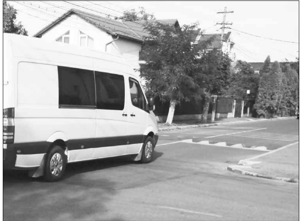
O dată cu montarea pragurilor de sol a scăzut considerabil numărul accidentelor