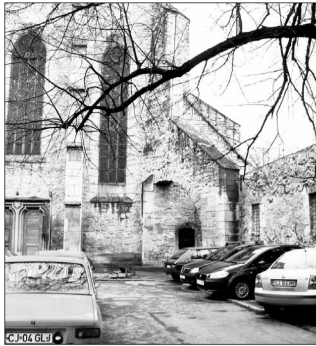
Strada Mihail Kogălniceanu va fi transformată în pietonală în zona Bisericii Reformate, iar statuia Sfântului Gheorghe va fi încadrată într-un ochi de apă

Vor dispărea toate cablurile aeriene de pe aceste străzi, cu excepția celor pentru tro-