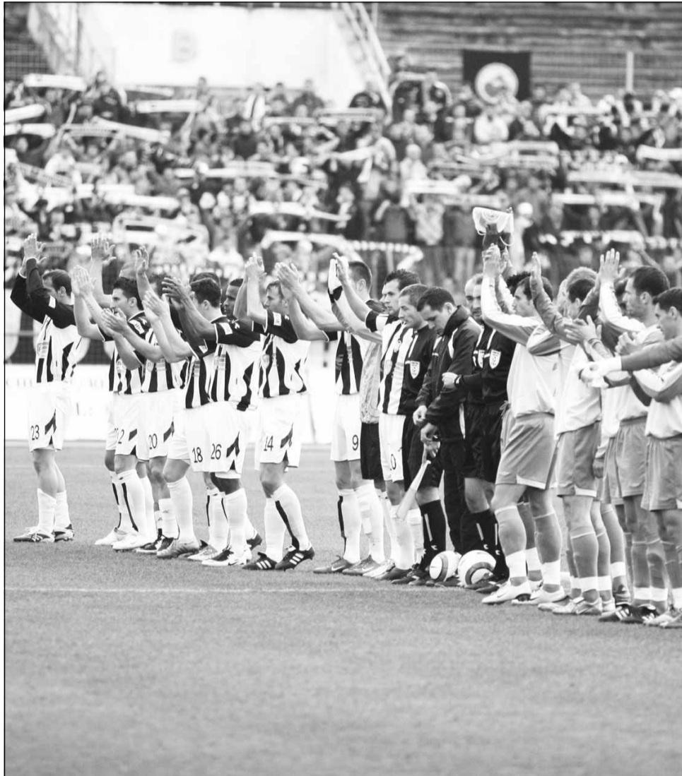
Jucătorii de la „U” Cluj și Mioveni salută publicul, înainte de startul meciului de la Liga 1 din ediția 2007-08 a Ligii 1

Universitatea Cluj va evolua în prima etapă în deplasare la CS Mioveni. „Șepcile roșii” își doresc să înceapă noul sezon cum l-au încheiat pe cel precedent, cu o victorie. „Este important să începem cu dreptul noul sezon. Am încredere în mine și în colegii mei,