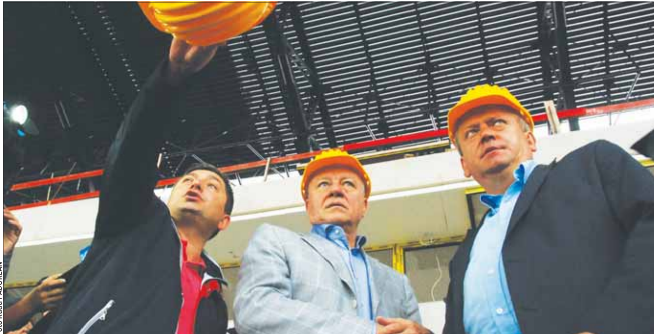
Președintele FRF Mircea Sandu a vizitat „Cluj Arena” însoțit de președintele Consiliului Județean, Alin Tișe, de vicepreședintele Radu Bica și de reprezentanți ai constructorilor și ai proiectanților

„Stadionul mă încântă cum arată, am văzut și o parte dintre facilități, care sunt de înaltă ținută. Să știți că simt emoții ca și pe stadionul din București și ca pe orice arenă nouă pe care intru. Dacă ne-am tot văitat până acum că ducem lipsă de infrastructură, iată că încep să crească noi stadioane după 50 de ani de când nu s-au mai făcut stadioane în România. Noile arene ne obligă și pe noi și cluburile să găsim soluții pentru a readuce fotbalul românesc în condiții de performanță. Asta nu se va întâmpla foarte curând și nu vreau nici să dezamăgesc, dar nici să păcălesc. Ceea ce a realizat Consiliul Județean aici, pentru mine este o surpriză mai mult decât plăcută, este o investiție la un preț extraordinar. La 30.000 și ceva de locuri, un preț de circa 35 de milioane de euro este foarte bun. Asta înseamnă că au drămuț foarte bine banii cei care i-au gestionat. Clujenii vor avea posibilitatea să fie respectați un pic mai mult acum cu acest nou stadion. Vor veni cu siguranță pe acest stadion și suporterii din alte țări, ceea ce se întâmplă și la București