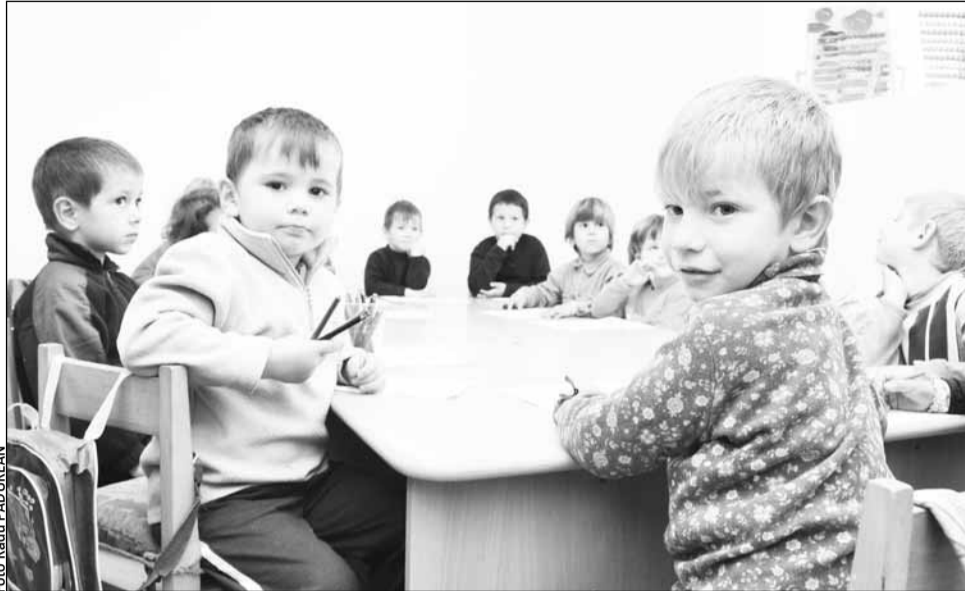
Unele grădinițe sunt deschise și în timpul vacanței de vară, iar grupele sunt comasate într-una singură