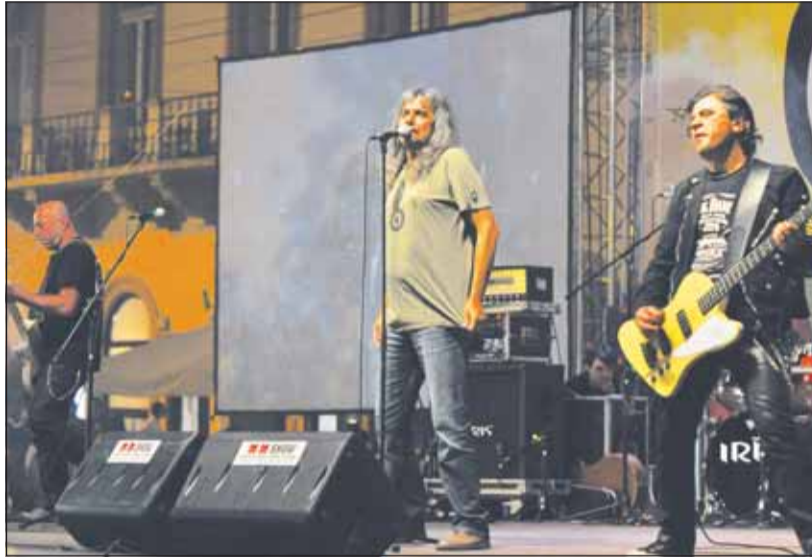
De la Iris la Paraziții, dujenii vor avea de unde alege la Ursus Evolution în materie de concert

“Ursus este aproape de noua generație din muzica românească pentru a o susține în dorința de a performa”, explică or-