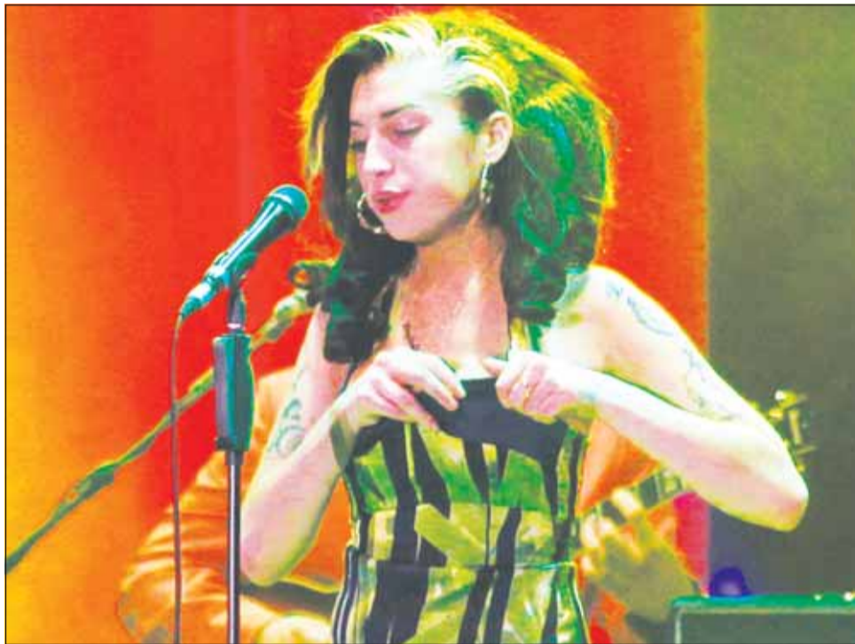
Amy Winehouse nu va mai cânta, pe 15 august, la București

"Amy Winehouse își anulează toate aparițiile programate în cadrul turneului său. Întreaga sa echipă va face tot ce se poate pentru a o ajuta să-și revină în cea mai bună formă. Îi vom acorda oricât timp are nevoie pentru ca acest lucru să se întâmple", au spus reprezentanții artistei britanice, într-un mesaj adresat tuturor fanilor din țările în care Amy Winehouse ar fi urmat să concerteze în această vară. "Suntem alături de fanii din România care așteptau cu nerăbdare acest concert și se simt dezamăgiți în aceste momente, dar decizia managementului a fost luată după o atentă analiză, ținând cont că perioada de