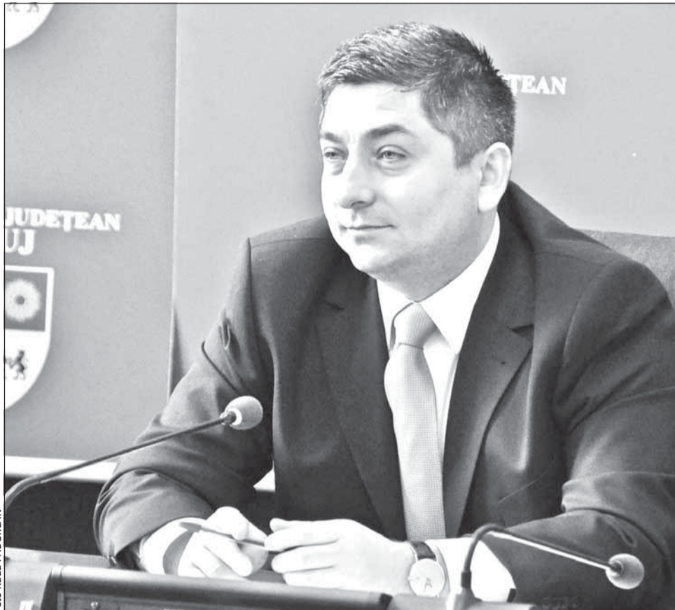
Președintele Consiliului Județean, Alin Tișe, ar vrea înființarea unei stații CFR în apropierea zonei în care este amplasat Aeroportul

În acest fel, pasagerii aeroportului ar putea să aleagă și calea ferată pentru a evita aglomerația de pe căile rutiere terestre. „Aeroportul Internațional joacă un rol cheie în economia întregii regiuni de nord-vest a țării. Încercăm să promovăm aici cele mai înalte standarde în calitatea serviciilor prestate, prin intermediul cărora să dezvoltăm, într-o manieră durabilă, un sistem aeroportuar performant, în contextul realizării accesului către infrastructuri adiacente și facilități necesare activităților aeroportuare. Accesul pasagerilor la aeroport trebuie facilitat și pe alți vectori de transport, alături de cei rutieri. Sperăm ca în cel mai scurt timp să putem oferi clienților aeroportului și posibilitatea folosirii eficiente a in-