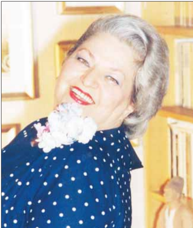
Secțiunea „Medalion” a Festivalului Comedy Cluj este dedicată marelui actriță de teatru și film Draga Olteanu Matei

Cele două filme sunt seminate de același regizor și au