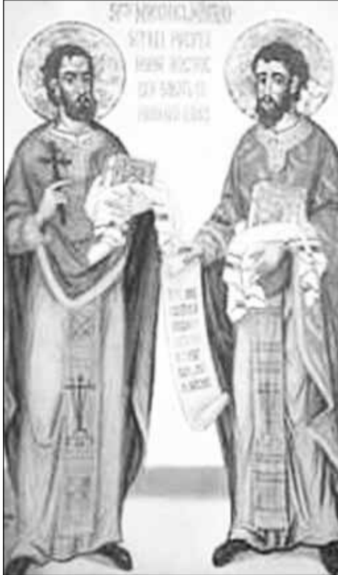
Cuvioșii mărturisitori Visarion, Sofronie, mucenicul Oprea și preoții mărturisitori Ioan din Gales și Moise Măcinic din Sibiel, icoane din sec. al XX-XXI-lea.

nează doleanțele românilor. Ca răspuns la cererile sale este întemnițat în temuta temniță din Kufstein, de unde nu se va mai întoarce.