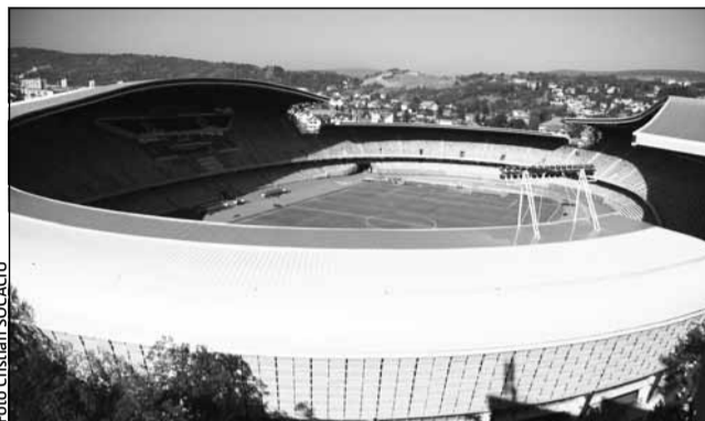
Turnul de 25 de etaje care ar fi urmat să fie ridicat în imediata vecinătate a „Cluj Arena” nu mai este de actualitate pentru Consiliul Județean