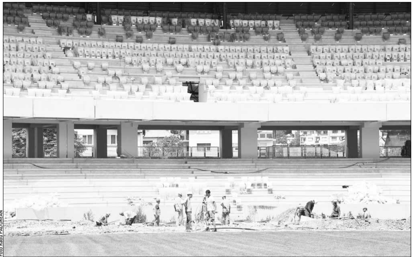
Consilierii județeni vor lua o decizie săptămâna aceasta cu privire la înființarea societății SC „Cluj Arena” SA, care se va ocupa de administrarea noului stadion al Clujului

Acționarii „Cluj Arena” SA vor fi județul Cluj, prin Consiliul Județean Cluj, cu o cotă de participare la capitalul social de 90% și Regia Autonomă de Administrare a Domeniului Public și Privat (RAADPP) al județului Cluj, prin directorul general, cu o cotă de participare la capitalul social de 10%. Capitalul social al societății, subscris și vărsat de către acționari conform cotelor de participare, este de