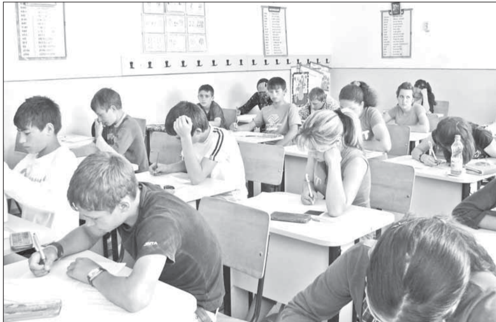
Niciun elev din județ nu a fost eliminat de la prima probă din cadrul Evaluării Naționale

Nici la nivel național nu au fost semnalate incidente în ceea ce privește transmiterea subiectelor. Pentru susținerea probei s-au înscris 223.222 elevi, examenul fiind organizat în 4.973 de unități