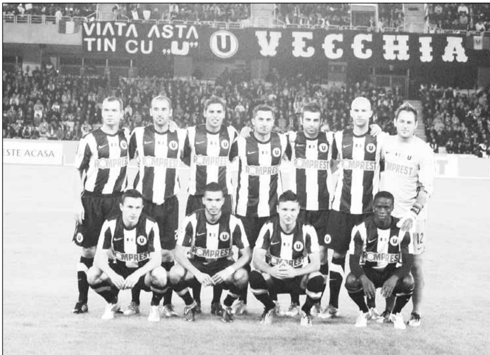
„Studentii” își doresc să continue parcursul bun de până acum în Liga 1

Antrenorul „alb-negrilor” apreciază că elevii săi au jucat bine în primul meci oficial de la Cluj Arena, cel cu FC Brașov, chiar dacă în ultimele 10 minute doar au ținut de rezultat. „Am făcut un meci bun cu Brașov. Cred că orice echipă are avantaj de un singur gol încercă să îl conserve în ultimele minute de joc. Ne așteaptă o partidă dificilă, Pandurii sunt un adversar redutabil, au un joc asemănător cu al nostru. Sunt o echipă de luptători, poate puțin cam duri, dar au și o calitate tehnică deosebită. Trebuie să rămânem lucizi, ca să putem găsi culoare de a marca”, a declarat Ionuț Badea. Tehnicianul „șepcilor roșii” a subliniat faptul că nu va menaja nici un jucător pentru următoarea partidă de acasă, cea cu Dinamo, pentru că nu obișnuiește să facă acest lucru. Ionuț Badea are tot lotul valid pentru meciul cu Pandurii.