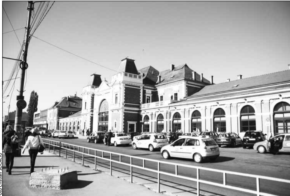
În prezent, în zona Gării există disfuncționalități atât la nivelul circulației auto, cât și la nivelul contactului pietonilor spre punctele de interes major din oraș