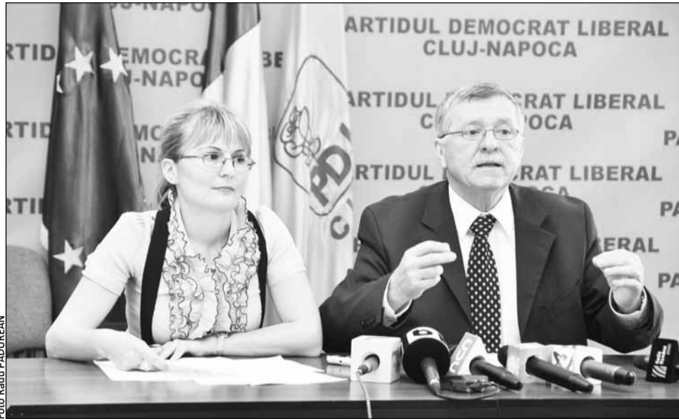
Mihail Hărdău, președintele Comisiei pentru Învățământ din Senat, și inspectorul general al Inspectoratului Școlar Județean Cluj (ISJ), Anca Hodoroștea atrag atenția că există „niște semne de întrebare în privința mersului învățământului românesc”

Declarațiile lor vin în contextul în care 40% din candidații din Cluj la concursul pentru ocuparea posturilor didactice din învățământul preuniversitar de stat din acest an au obținut note între 7 și 10, având astfel posibilitatea să se titularizeze, mai puțini cu aproximativ 10% față de anul trecut. În plus, 23,5% dintre ei au obținut note sub 5.