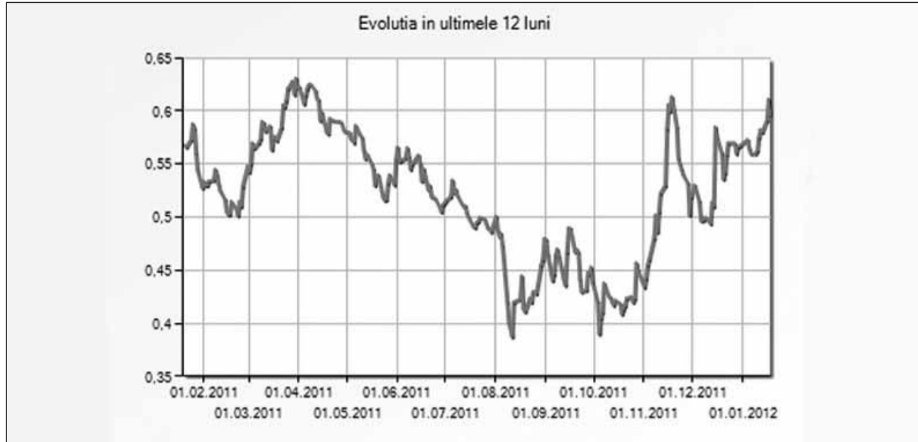
Evoluția prețului acțiunilor SIF 3 în ultimele 12 luni

Societatea și-a redus în decurs de un an activele imobilizate la jumătate, de la peste 750 de mil. lei la 346 mil. de lei, în timp ce activele circulante au crescut în 2011 față de 2010 de 13 ori, de la 75 de