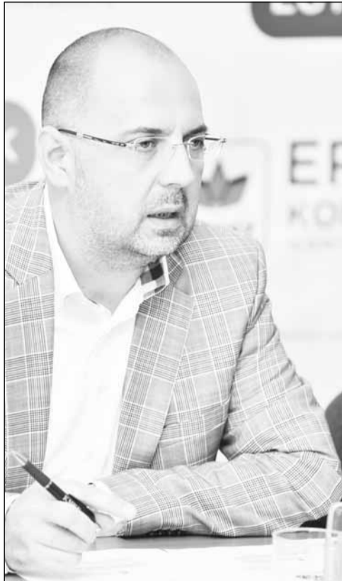
„Dacă s-au supărat și unii și alții înseamnă că suntem pe calea cea bună”, spune liderul UDMR, Kelemen Hunor, în replică la declarația președintelui PSD, Victor Ponta, că USL nu mai vrea să guverneze cu UDMR

Președintele PSD, Victor Ponta a declarat vineri că USL nu mai vrea să guverneze cu UDMR, susținând că obiectivul alianței este să obțină 50% din mandatele din Parlament la alegeri. Mai mult, potrivit lui Ponta, UDMR trebuie să treacă în opoziție, întrucât „a obosit” după atâția ani la guvernare.