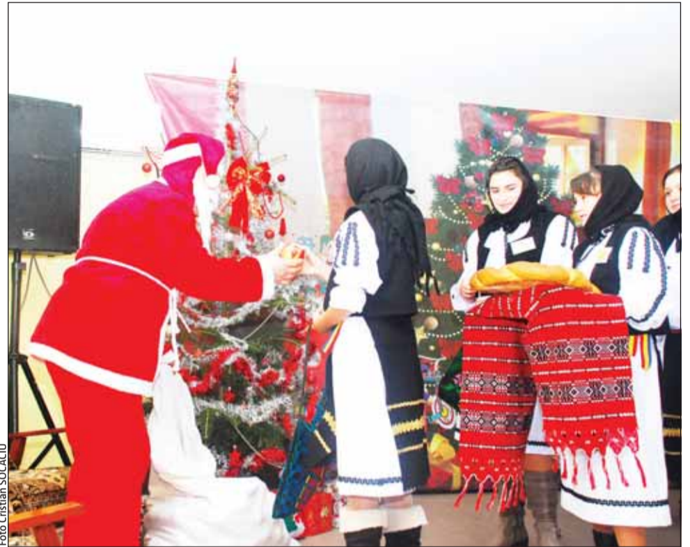
Moș Crăciun a împărțit cadouri celor peste 200 de copii veniți la Ceanu Mare din toate colțurile țării să colinde