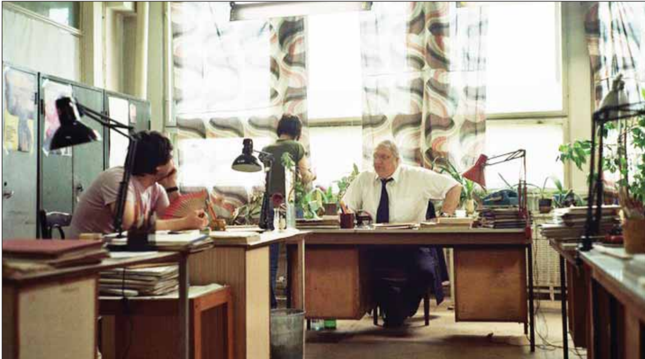
Secvență din filmul „Visul lui Adalbert”