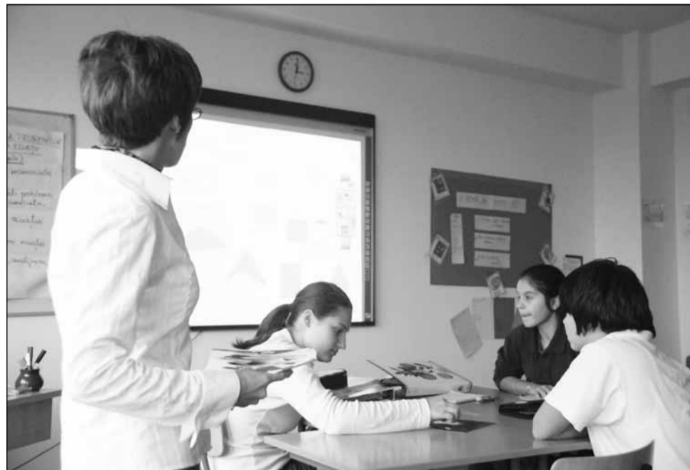
Majoritatea profesorilor consideră că ar exista alte metode, mult mai eficiente, față de testele de evaluare inițială, pentru a crește rezultatele la examenele naționale

În privința costurilor pentru aplicarea acestor teste ini-