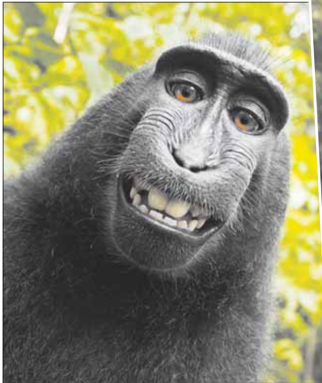
Femela de macac și-a făcut câteva sute de poze, dintre care unele chiar foarte reușite

„Până am reușit să-mi recuperez aparatul maimuța își făcuse deja sute de poze, dar foarte multe dintre ele nu era focalizate – aici «fotografii» mai are de învățat”, a spus răsând Slater. El a adăugat