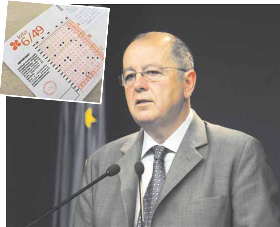
Constantin Cerbulescu, președintele ANPC, povestește că un român s-a adresat instituției, deoarece nu a câștigat la loto, deși horoscopul dintr-un ziar spunea că are șanse mari

“De fiecare dată încercăm ca și consumatorul român să fie un consumator european, care să înțeleagă că în relația cu agenții economici ei nu au numai obligații, au și drepturi. Dreptul cel mai important pe care îl are un consumator român este dreptul de a putea sesiza, de a putea ajuta autoritățile statului să își facă datoria și să elimine de pe piață multe dintre produsele neconforme. Un lucru