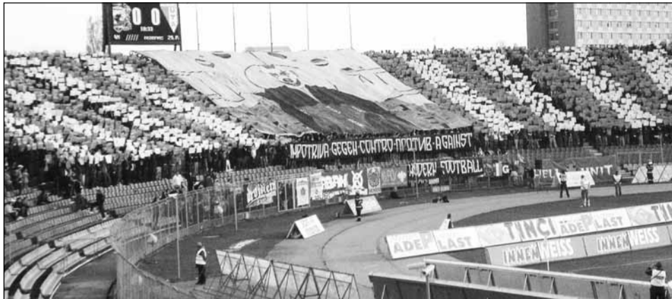
Fanii Politehnicii își vor încuraja echipa în liga secundă