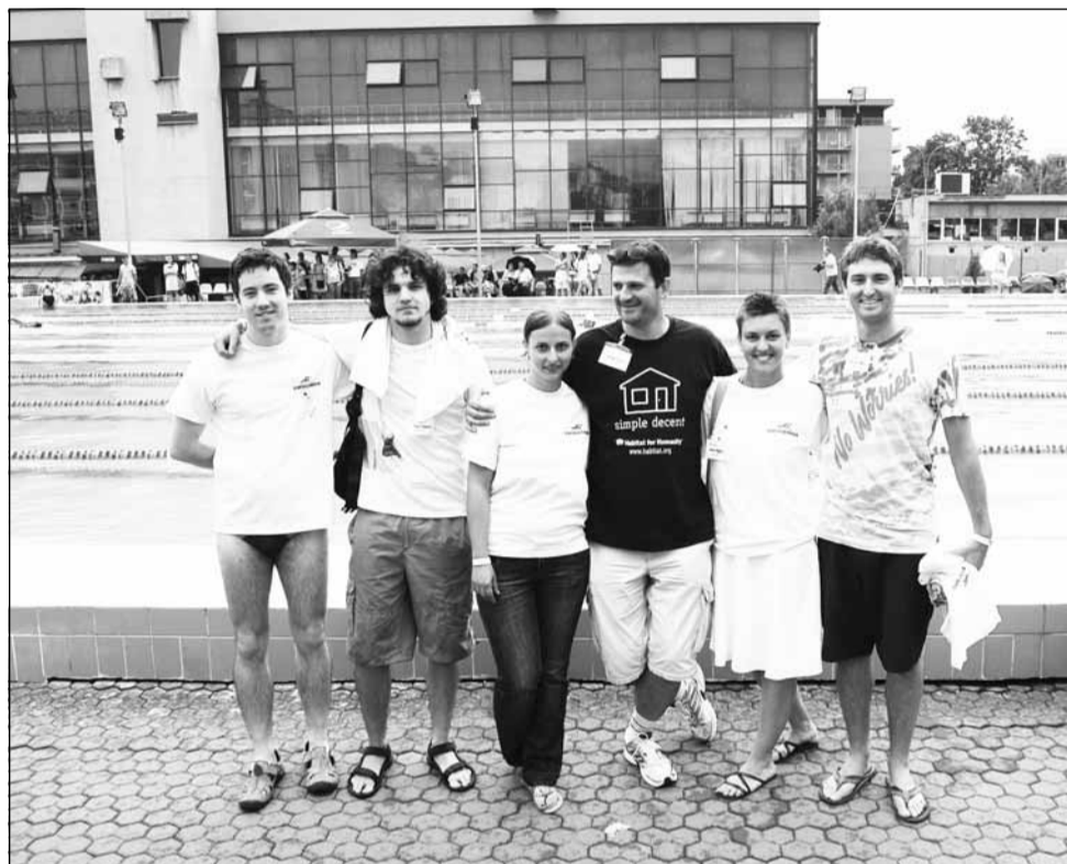
Cei șase înotători au reușit să strângă peste 9.000 lei care vor fi folosiți la finalizarea unei locuințe care va schimba viața unei familii