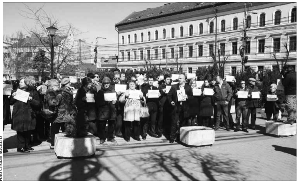
Reprezentanții USL au manifestat vineri în fața prefecturii clujene împotriva înființării facultății în limba maghiară la UMF Târgu Mureș

„Vrem să vedem care sunt elementele tehnice care au dus la situația de azi de acolo. Ne dorim să identificăm dacă sunt elemente de natură legislativă care să facă obiectul intervenției noastre. Dacă acestea sunt elemente de această natură s-ar putea modifica Legea Educației”, a declarat ieri, senatorul democrat liberal. El i-a criticat și pe politicienii din Opoziție care sus-