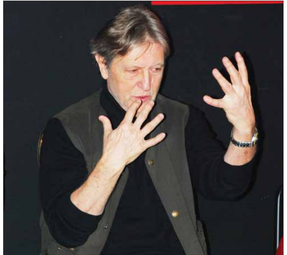
În viziunea lui Andrei Șerban, „Hedda Gabler” este o satiră socială care reflectă societatea în care trăim la ora actuală