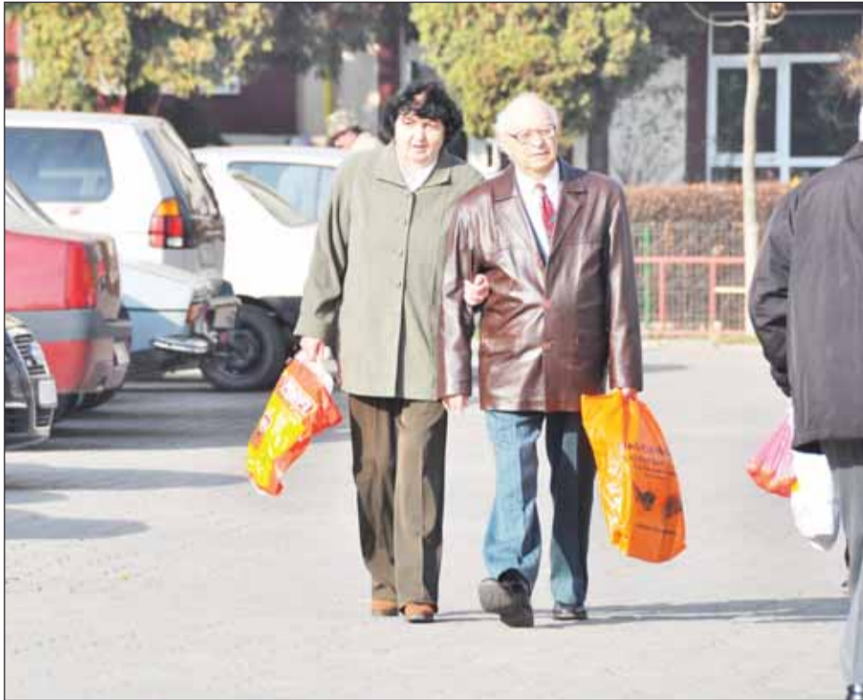
Pensionarii clujeni pot depune deja cererile pentru a pleca la tratament în stațiunile balneare din țară

Anul trecut, aproximativ 9.000 de pensionari și-au depus cerere pentru bilete de tratament în stațiuni și au fost repartizate doar 6.000 de locuri. Chiar dacă au fost mai multe cereri decât bilete disponibile, conducerea CJP Cluj a precizat că „nu a fost cetățean care să nu poată să meargă la tratament”, iar asta deoarece mulți dintre cei care au depus cerere s-au retras din diverse motive. Astfel s-a ajuns chiar la situația să fie returnate 400 de bilete.