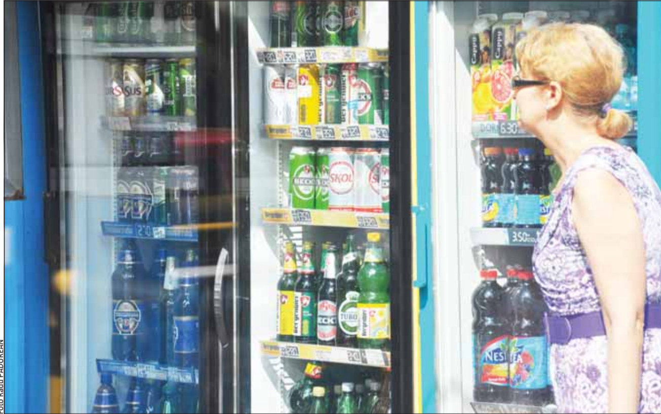
Clujenii se pot adresa inspectorilor de la Protecția Consumatorului în cazul în care constată că frigiderele de băuturi nu sunt puse în funcțiune de comercianți

Situația se întâlnește frecvent nu mai departe de centrul orașului. Absolut toate magazinele care comercializează băuturi le expun în frigider și lăzi frigorifice, pentru că așa cere legea, dar acestea nu funcționează întotdeauna, pentru că patronii fac economie la energia electrică și nu bagă instalațiile în priză. Iar dacă ai "tupeul" să faci