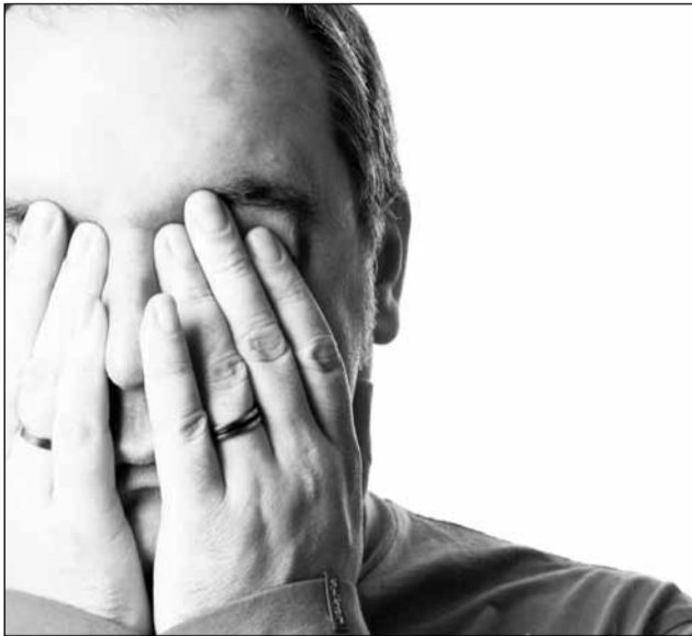
Un studiu realizat de Patronatul Mediciniei Integrative în București, Cluj-Napoca și Iași a scos la iveală problemele cu care se confruntă bolnavii de cancer

Potrivit rezultatelor studiului, autoritățile au un nivel de interes și implicare în sprijinirea bolnavilor minim. Cei care au participat la cercetare consideră că sistemul medical românesc este depășit de numărul mare de cazuri, din acest motiv angajații spitalelor fiind suprasolicitați, ceea ce duce de multe ori la relații tensionate cu pacienții. „Deși se recunoaște existența unor cadre medicale deosebite atât din punctul de vedere al pregătirii profesionale, cât și al modului în care gestionează relația cu pacienții, numărul exemplarelor negative și impactul acestora pare să în-