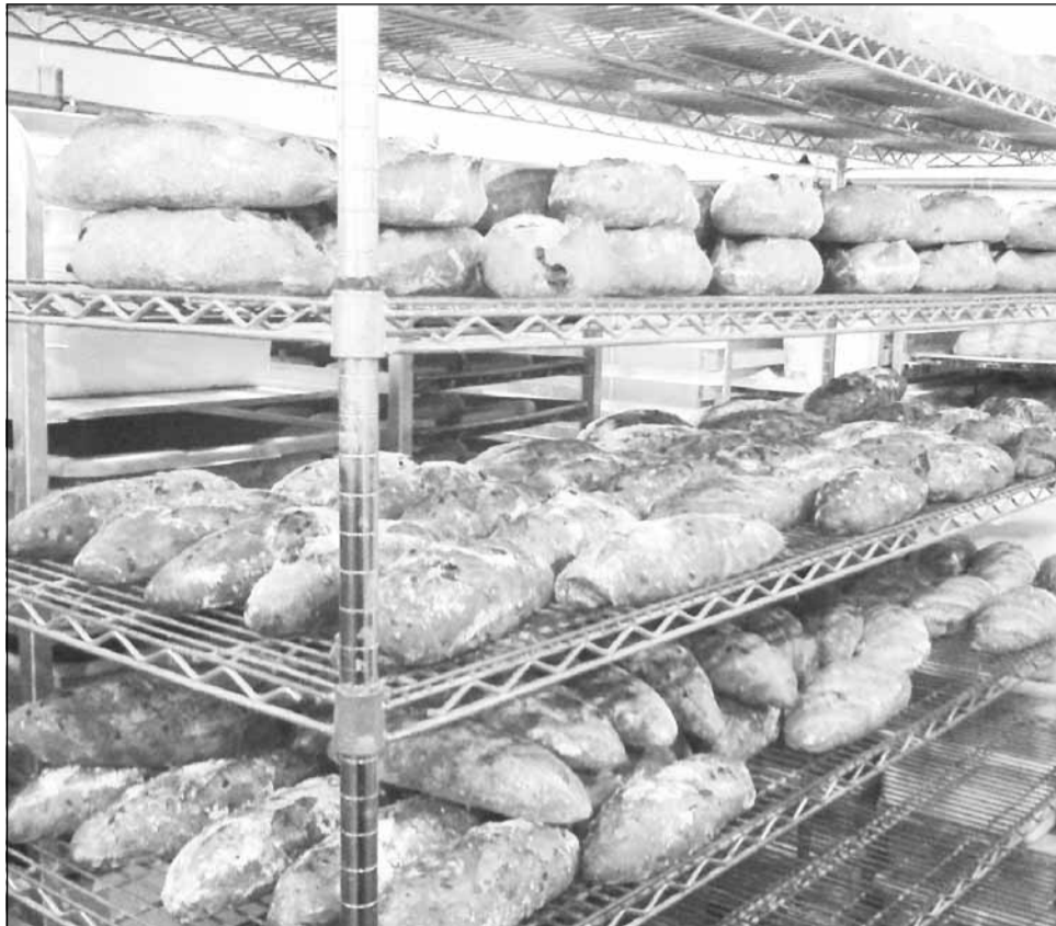
Șansele ca producția record de grâu obținută anul acesta să determine scăderea prețului pâinii sunt infime, spun producătorii din domeniu

“Consider că ceea ce întâlnim acum pe piață este o atitudine speculativă. Probabil că se dorește depozitarea grâului până în ianuarie, când prețul crește. Oamenii s-au obișnuit cu un preț mare și nu vor să îl scadă. Chiar acum suntem în tratative cu un producător din Carei care nu vrea