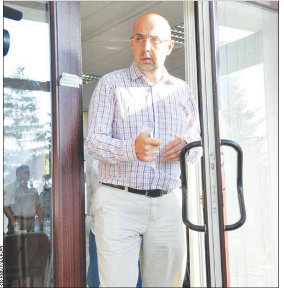
Potrivit ministrului Culturii Kelemen Hunor, în 2000-2001, statul român „ar fi fost corect dacă ar fi spus: «Da, v-am dat licență, începeți lucrările», respectând niște condiții absolut necesare, sau ar fi trebuit să spună: «Mergeți acasă».

Planul de punere în valoare a vestigiilor arheologice va fi realizat prin alocarea de că-