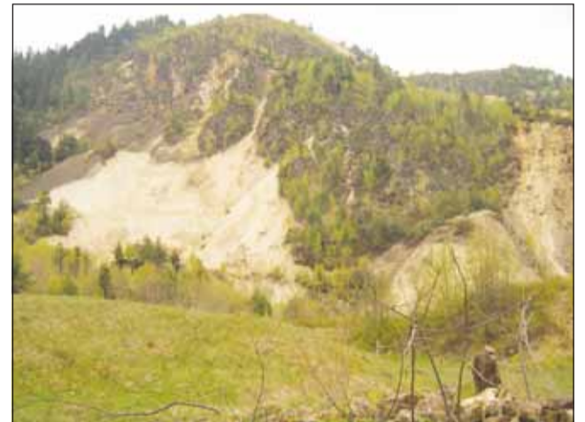
La sfârșitul săptămânii trecute, Direcția pentru Cultură Alba a emis certificatul de descărcare de sarcină arheologică pentru o parte din masivul Cărnic