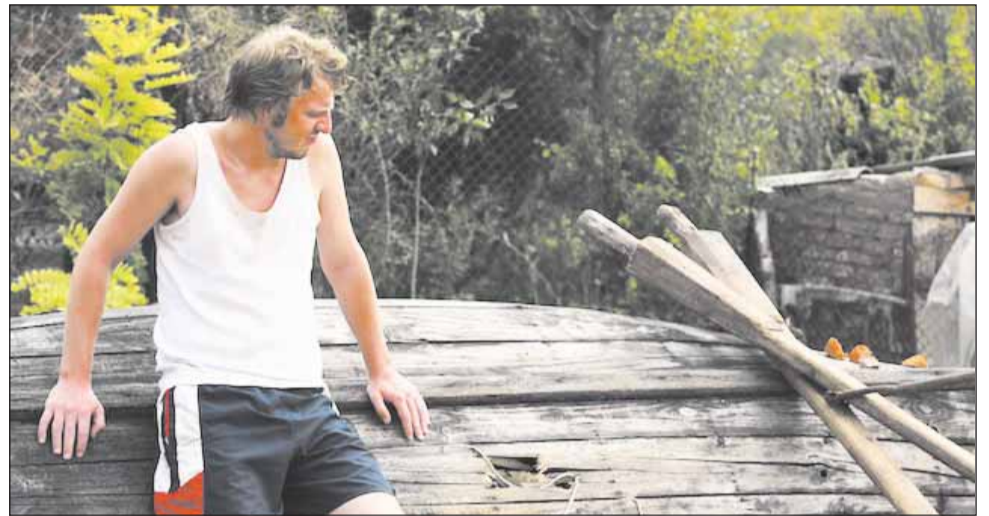
Secvență din scurtmetrajul ”Bora Bora”, selecționat pentru Festivalul de Film de la Locarno

Pelicula ”Bora Bora”, recompensată cu Premiul Zilelor Filmului Românesc pentru secțiunea scurtmetraj la cea de a zecea ediție a TIFF, a fost selecționat la Locarno în cadrul secțiunii ”Pardi di Domani”, secțiune unde a fost premiat în