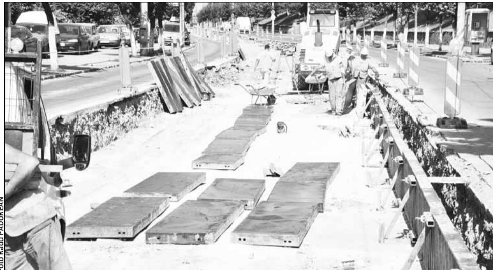
Lucrările la linia de tramvai încep astăzi și pe strada Splaiul Independenței, circulația rutieră fiind din această cauză închisă

Pe direcția Gară – Mănăștur autobuzele vor circula pe ur-