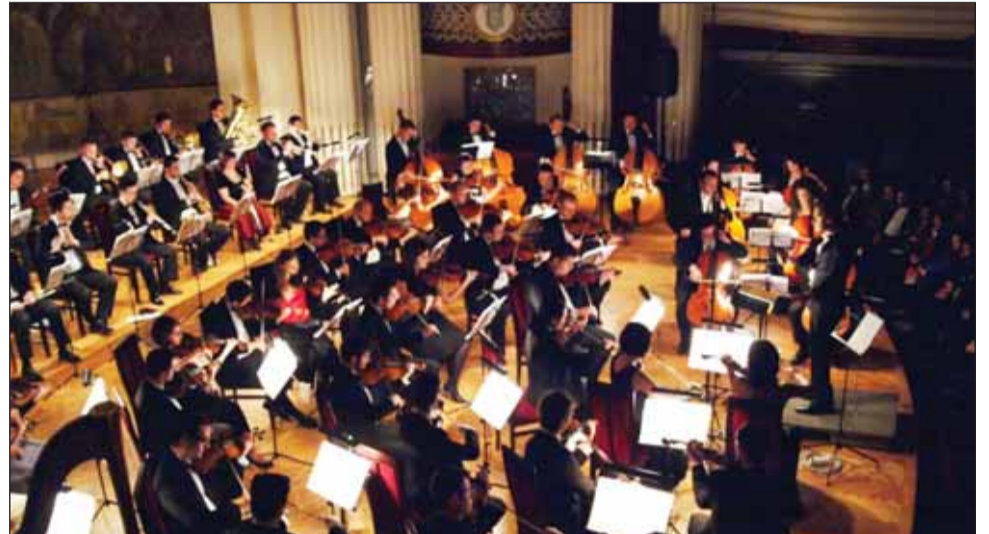
Finalul concertului a fost animat de un „Dorel” îmbrăcat în salopetă de muncitor, care a acompaniat cu două ciocane și o nicovală orchestra „Notes&Ties”

Maestrul de ceremonii al concertului de luni seara a fost ta-