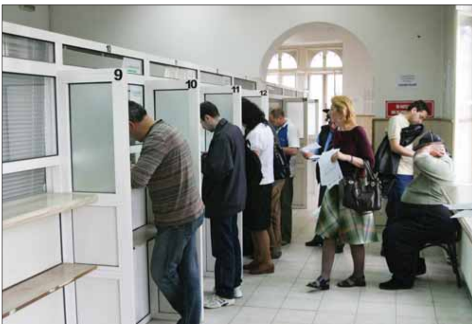
Afaceriștii clujeni cer ca legislația să fie modificată astfel încât să permită înființarea unei firme în trei zile, iar depunerea raportărilor sau a informărilor să se facă o singură dată