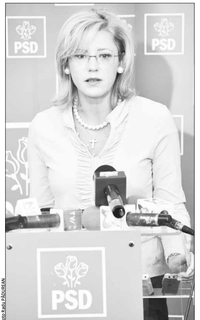
Europarlamentarul Corina Crețu a vorbit ieri, la Cluj despre proiectul regionalizării și alegerile de anul viitor

Europarlamentarul critică acțiunile extremiste ale cetățenilor din Ungaria care săptămâna trecută au încercat să amplaseze, la intrarea în Cluj-Napoca o plăcuță inscripționată Koloszar. Potrivit Corinei Crețu, partidul Jobbik este un partid „care din păcate a ajuns în Parlamentul European și care are trei reprezentanți. Reprezentanții Jobbik au păreri de-a dreptul fasciste, iar acțiunile extremiste nu trebuie susținute”.