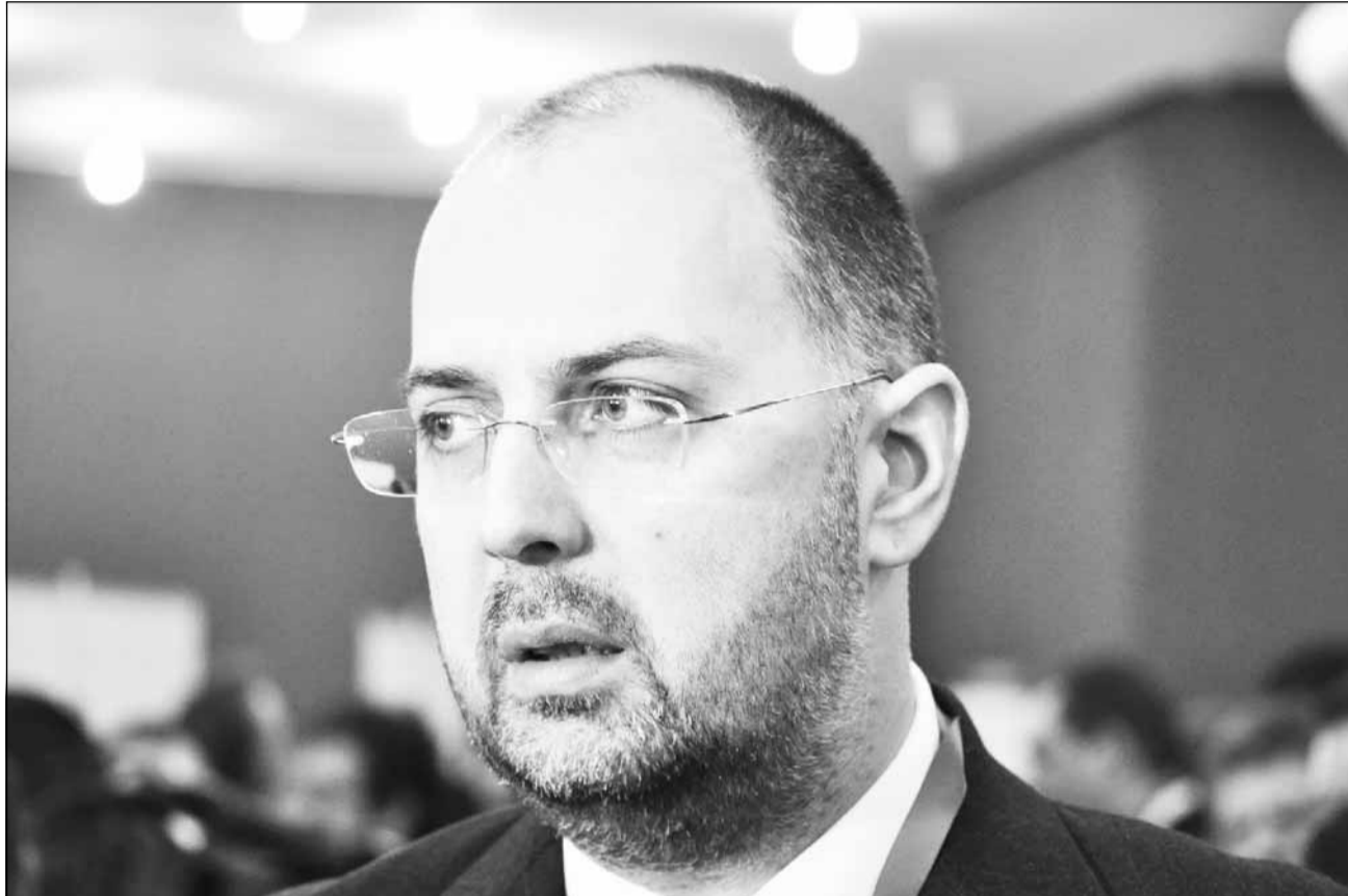
Președintele UDMR, Kelemen Hunor, propune un candidat unic al maghiarilor pentru postul de primar al Clujului

Liderul Consiliului Național al Maghiarilor din Transilvania (CNMT), regiunea Transilvania, Gergely Balasz nu exclude o colaborare cu UDMR, dar – spune el – “sunt realist”: la Cluj doar 18% sunt maghiari, iar șansele ca acest oraș să aibă un primar maghiar sunt mici, argumentează el. Pe de altă parte, spune el, o colaborare cu PCM este exclusă, pentru că acesta este un “partid pierdut în spațiu”.