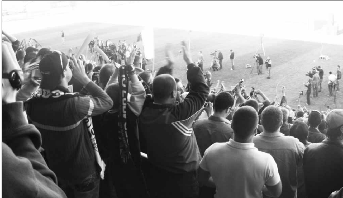
Meciul de mâine dintre Steua și ȚSKA Sofia, care se va disputa pe stadionul "Constantin Rădulescu", a suspectat de blat

Conform cotidianului bulgar "7 Dni Spor", o înțelegere privind un rezultat dinainte stabilit ar aduce beneficii de pe urma pariurilor atât echipei calificate în grupele Ligii Europa, cât și celei care ratează accesarea în faza următoare a competiției. Pe rezultatul meciului dintre Steaua și ȚSKA ar urma să se parieze în special în Asia, menționează 7sport.net, care precizează că UEFA suspectează de aranjamente și monitorizează în special partidele din estul Europei. Afirmatia cotidianului bulgar se bazează pe spusele reprezentantului UEFA, Peter Li-