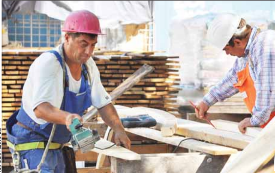
Principala atracție a Cazinoului, va fi sala mare de la parter, care va avea o podea din plăci de mozaic