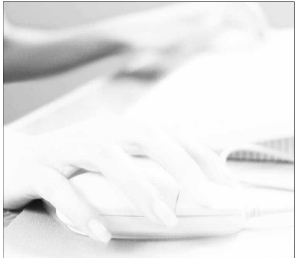
Afacerile de tipul „bani pe net din click-uri” au devenit o metodă populară de înșelătorie

Reprezentanții agențiilor de publicitate clujene au declarat pentru Monitorul că nu cunosc ca această modalitate de a obține vizualizări să fie folosită