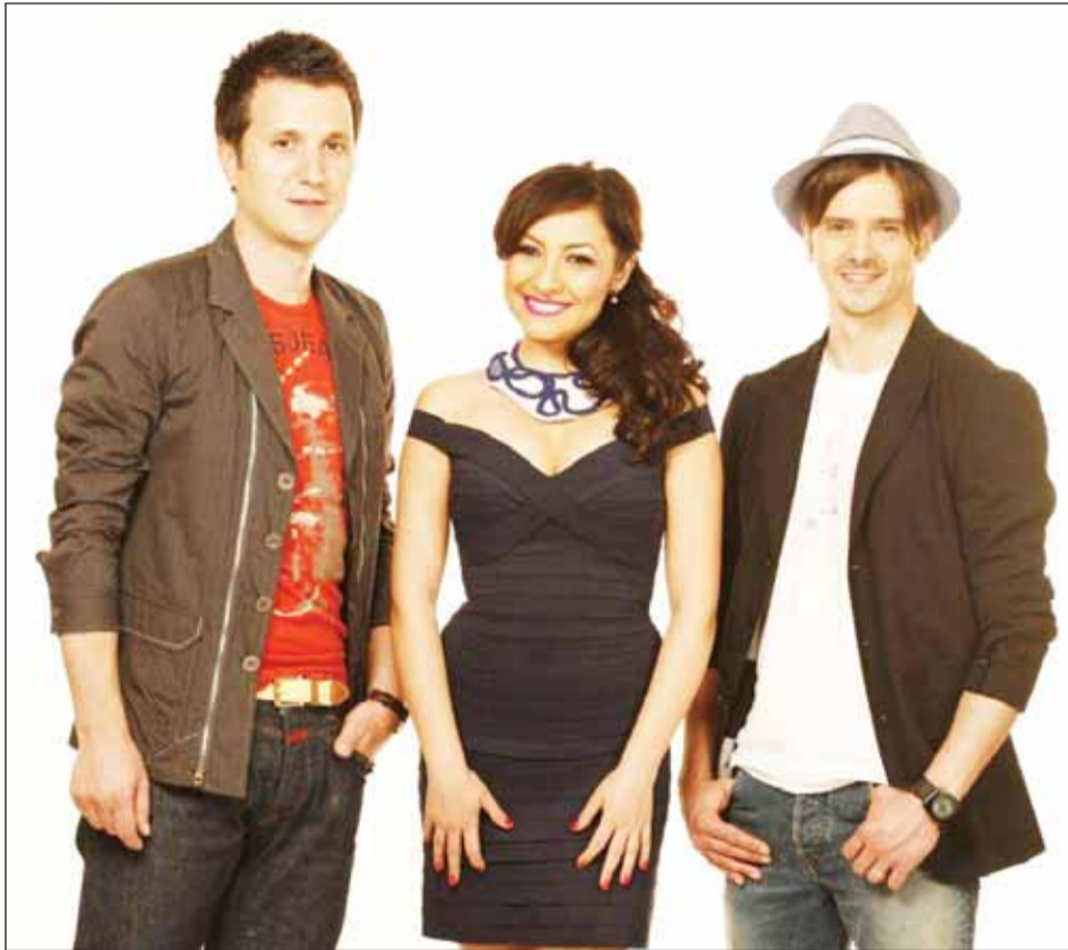
Andra, Andi Moiescu și Mihai Petre vor căuta pe 6 septembrie la Cluj noi talente

„Eu nu mă gândesc foarte mult la cum o să fie. Știu că vreau să fiu uimit, surprins, emoția de pe scenă să ajungă la mine în doze mari. Cred și sper că oamenii au prins curaj și și-au dat seama că acest show le poate transforma visele în realitate și le poate schimba viața”, a declarat Mihai