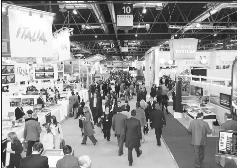
Primăria Cluj-Napoca va promova atracțiile turistice din oraș la târgul de la Madrid

Târgul de turism va fi dedicat atât specialiștilor, mai exact, principalilor jucători din industria de turism, care vor analiza ofertele expozanților, având drept obiectiv elaborarea unei strategii în domeniu, cât și publicului larg. Anul trecut, la eveniment au participat peste 10.400 de companii, orașe, organizații de cultură, universități, asociații comerciale, agenții de turism din 166 de țări și regiuni ale globului. Târgul a fost vizitat de peste 200.000 de specialiști în turism și potențiali turiști, iar evenimentul a fost mediatizat de peste 7.700 de jurnaliști din 59 de state.