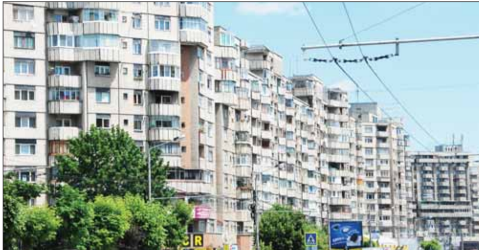
Numărul de apartamente disponibile prin executări silit va fi mai mare în acest an, sunt de părere specialiștii

Numărul în creștere al creditelor neperformante îi determină pe reprezentanții pieței imobiliare să estimeze creșterea numărului de executări silit, cu influență directă asupra întregii piețe. „Numărul de apartamente disponibile