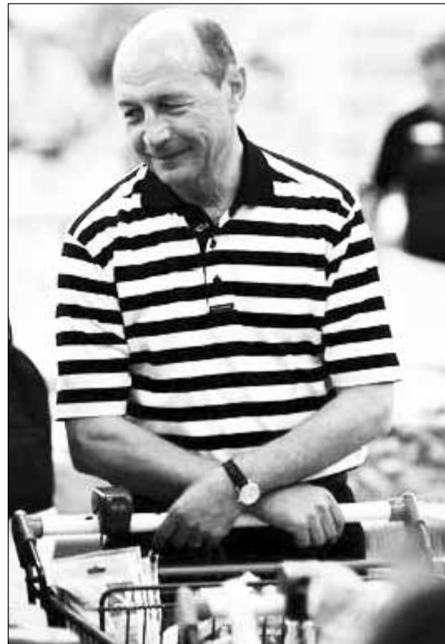
„Cumpărarea de alimente devine mult mai distractivă atunci când președintele României este în preajmă”, se precizează într-un articol al publicației britanice „The Economist”

Șansele României de intrare în spațiul Schengen sunt puse de redactorii de la „The Economist” exclusiv pe suc-