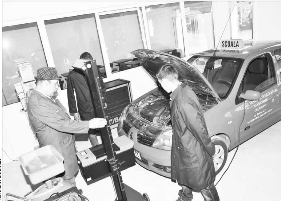
Elevii de la Colegiul Tehnic de Transporturi "Transilvania" au la dispoziție un atelier auto cu aparatură de ultimă generație

„Acest atelier înseamnă ceea ce am dorit întotdeauna pentru elevii din Cluj, adică o îmbinare a teoriei și practicii cu finalizarea angajării elevului. Noua curriculă pe care am gândit-o nu conține vorbe goale. Acesta este