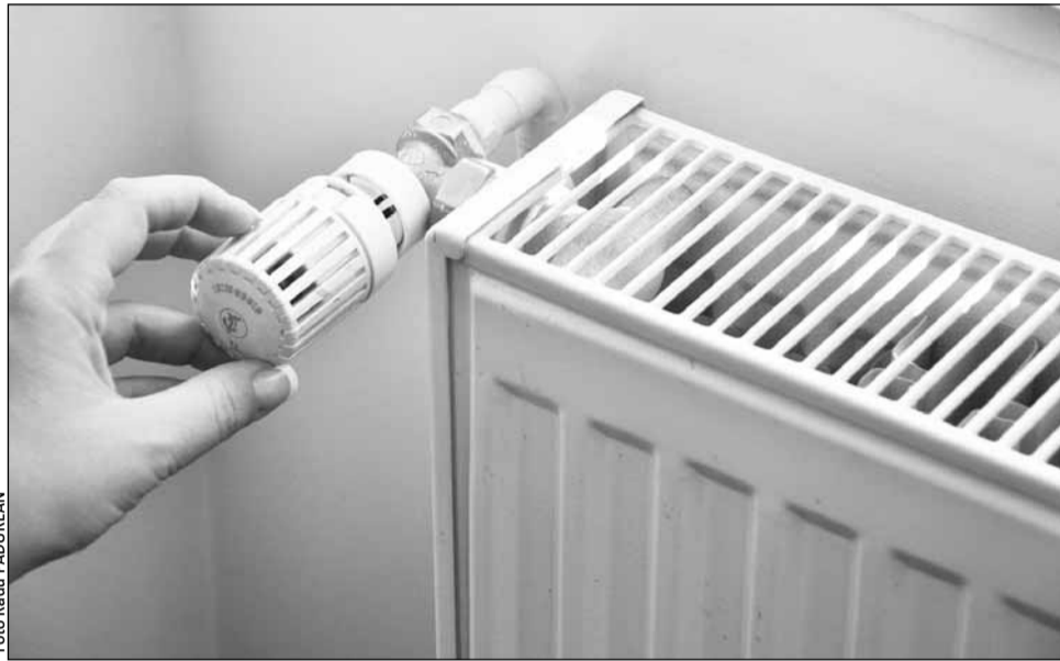
Cei care solicită ajutor de încălzire vor fi controlați de vaci, scutere sau alte bunuri care i-ar face neeligibili

Potrivit unui comunicat de presă al Guvernului, „principala modificare introdusă prin Hotărârea de Guvern vizează creșterea procentului de dosare care vor fi verificate, prin efectuarea de anchete sociale la domiciliu sau, după caz, la reșe-