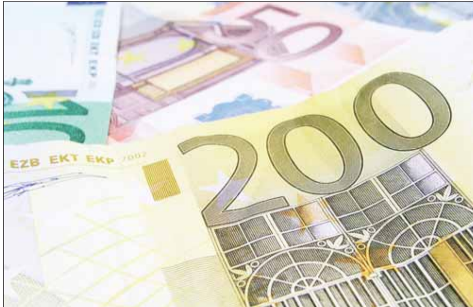
Care sunt avantajele noastre dacă intrăm în „clubul euro” și care sunt avantajele lor?

România ar beneficia în mod direct, financiar, de spri-