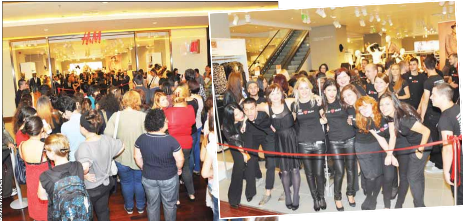
Sute de clujeni, inclusiv persoane de vârstă a treia, au stat ieri la coadă pentru a intra printre primii în noul magazin H&M inaugurat la Cluj

„De acum și fanii din Cluj se pot bucura de oferta H&M – modă și calitate la cel mai bun preț. Noul magazin îi va