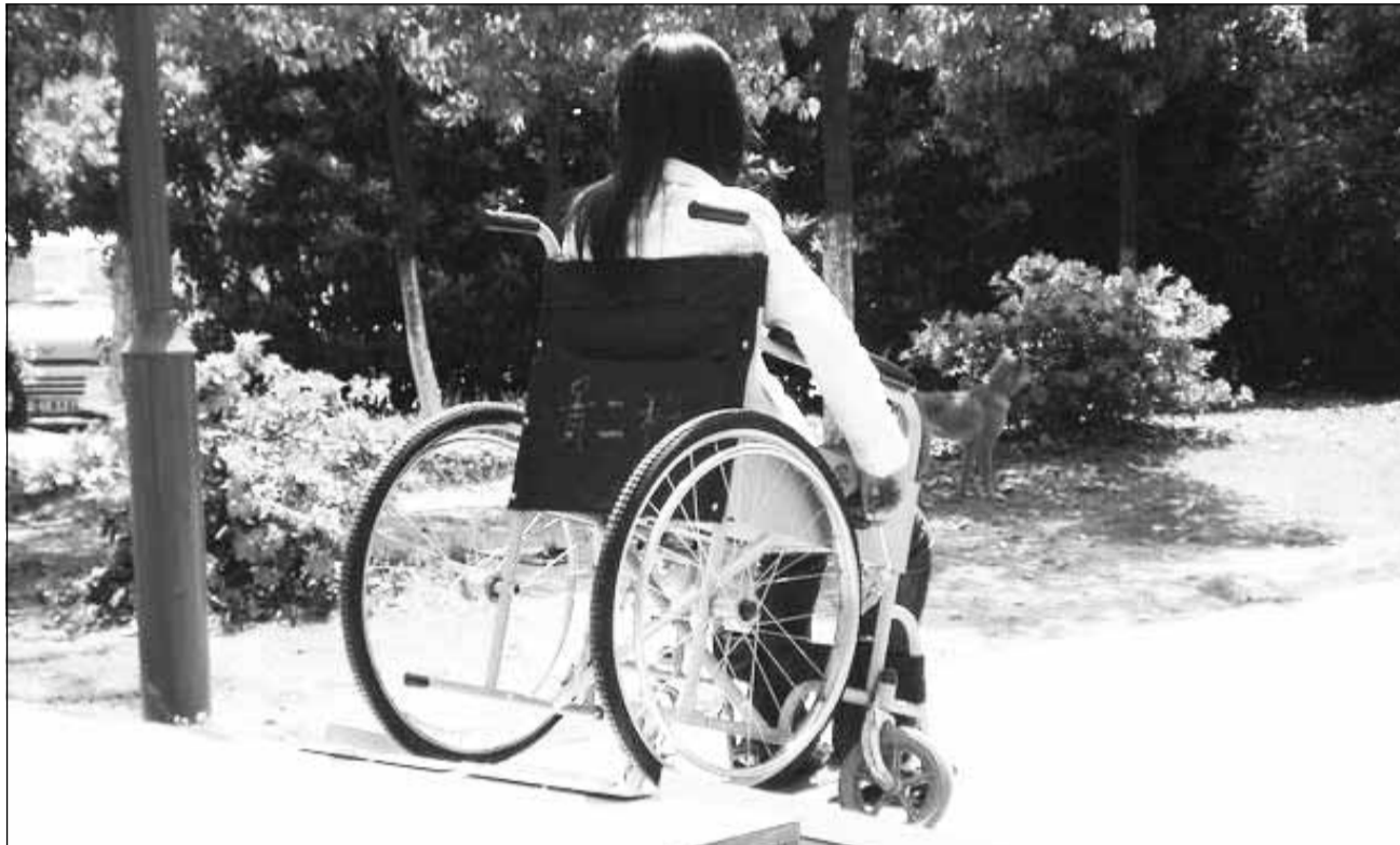
Persoanele cu handicap solicită inclusiv scutirea de impozit pe locuință și adaptarea liftului în scările de bloc fără a fi necesar acordul vecinilor

Semnatarii petiției solicită să fie obligatorie construirea de rampe de acces din locuința privată la spațiul public acolo unde există persoane cu dizabilități locomotorii și este solicitat acest lucru, respectiv construirea rampei și adaptarea liftului în scările de bloc fără a fi necesar acordul vecinilor.