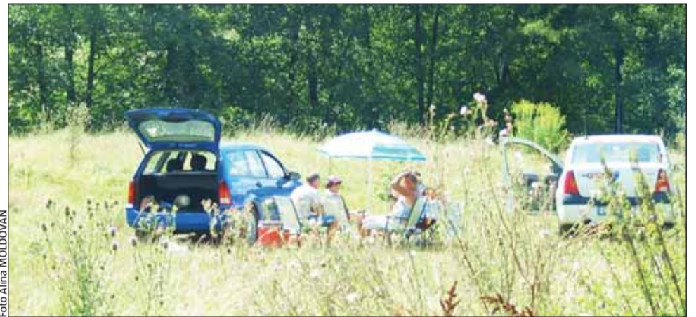
Ieri, clujenii nu s-au mai înghesuit ca în alți ani „la grătare” în pădurea Făget

Deocamdată, Primăria a amenajat în Făget câteva grătare și mai multe coșuri de gunoaie. Cu toate astea, planul de viitor al autorităților locale este să transforme zona de agrement într-una de picnic, cu alei, suprafețe amenajate, intrări și ieșiri controlate. Deocamdată, din lipsa suprafețelor disponibile, autoritățile locale au pierdut fondurile alocate de Ministerul Mediului și a Pădurilor pentru amenajare. Până atunci, zilele cu soare se recunosc după gunoaiele ce rămân în urma turiștilor.