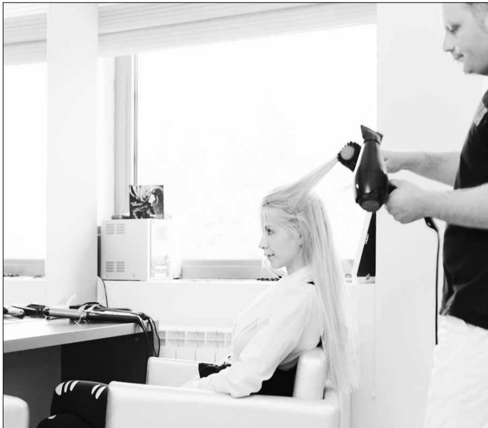
Clujencele dau tot mai puțini bani pe servicii de înfrumusețare, se plâng managerii saloanelor

„Nu e o afacere ușor de manageriat, am întâmpinat probleme deoarece cheltuielile estimate în cadrul planului de afaceri au fost mult depășite ulterior”, a precizat managerul unui salon închis în prezent. Un alt neajuns invo-