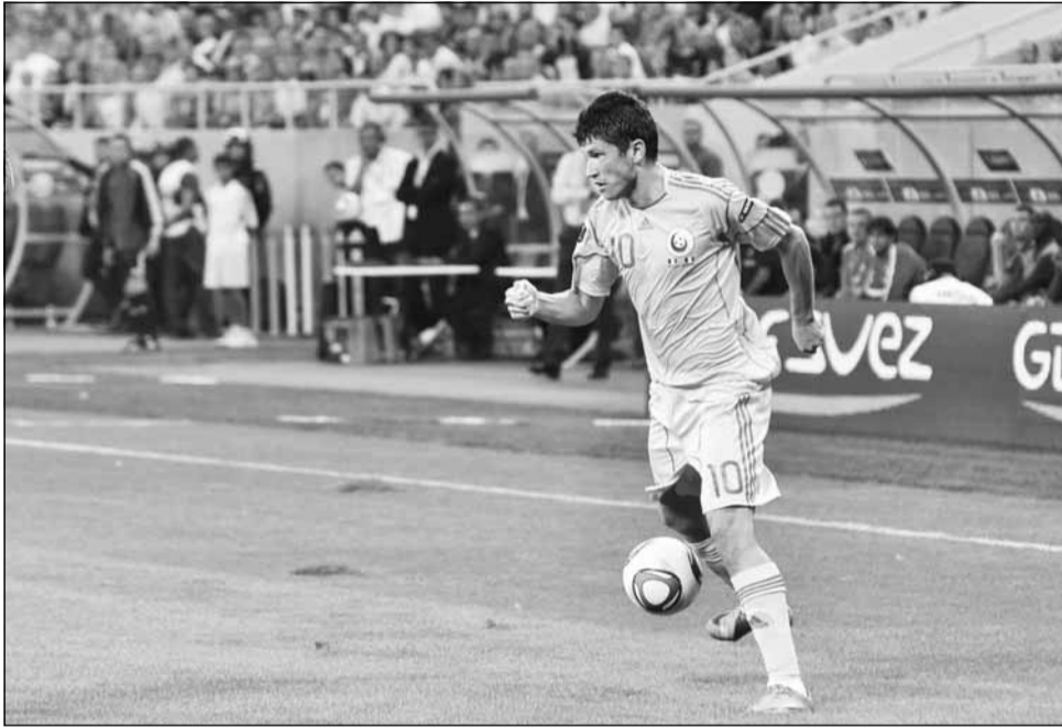
„Tricolorii” vor juca un amical împotriva Greciei, campioană europeană în 2004

Selecționerul reprezentativei Greciei, Fernando Santos,