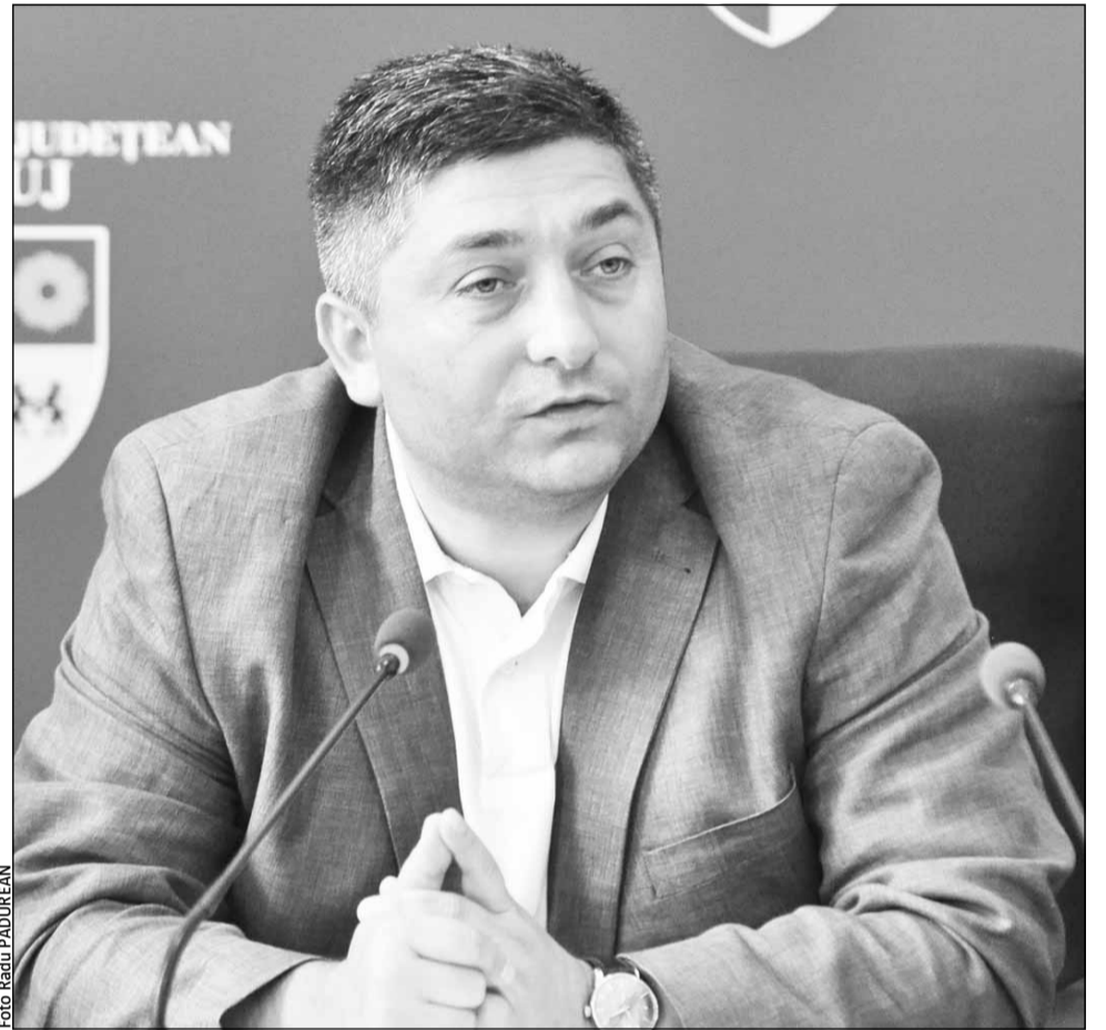
„Anul viitor, Consiliul Județean va fi concentrat pe pistă, drumuri județene și spitalul de urgență”, a declarat președintele forului județean, Alin Tișe

Viitorul spital regional de urgență va asigura primirea, investigarea și tratamentul definitiv al tuturor categoriilor de urgențe critice, traumatice, chirurgicale, neurologice, neonatologice și cazurile grave de arsuri. Principalul avantaj al realizării unui spital regional de urgență constă în faptul că în cadrul aceleiași locații sunt adunate toate specialitățile necesare rezolvării cazurilor medicale complexe în regim de urgență, eliminându-se astfel timpii de așteptare a pacienților aflați în stare gravă și asigurându-se stabilirea unor diagnostice și tratamente rapide și eficiente.