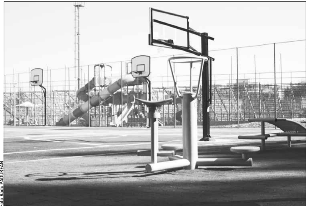
Parcul Mănăstur 2 a fost dotat cu aparate de fitness, complexe de echipamente de joacă pentru cei mici, panouri de baschet și o masă de ping-pong

Suprafața parcului este de 4.600 mp, iar spațiul verde