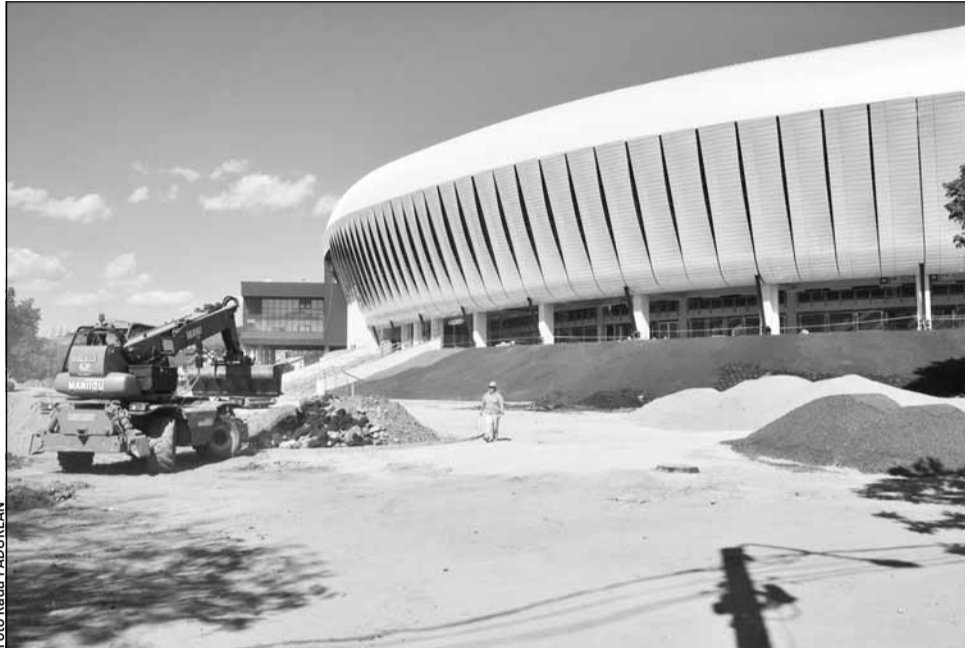
Interiorul stadionului e aproape gata, iar în exterior se lucrează la zona pietonală

„Din punct de vedere al calității, constructorul și subcontractorul care a furnizat gazonul ne-au asigurat că nu va fi nici un fel de problemă. Gazonul din Cluj este instalat de peste trei luni și, din punctul nostru de vedere, nu au de ce să fie probleme. Sunt convins că nu vom avea surprize la inaugurare. Este important și de unde se aduce gazonul, dar cel mai important lucru este ca el să aibă un timp fizic pentru a se prinde în pământ. La București problema a fost că nu a existat acest timp fizic pentru înrădăcinare și atunci acel rulo care a fost întins nu a rezistat la un joc de fotbal și a sărit. Asta nu înseamnă că a fost de proastă calitate gazo-