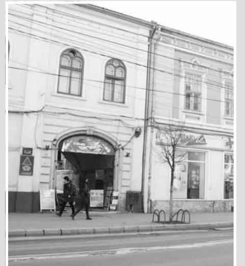
Studio Foto Best Media Factor, str. Memorandumului nr. 23, etaj I, ap. 10