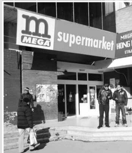
Magazin Mega SuperMarket, Hala Agroalimentară