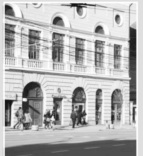
Librăria BIBLOS, piața Avram Iancu nr. 13