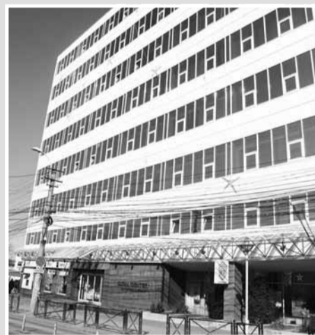
Redacția Monitorul de Cluj SIGMA Business Center Cluj-Napoca, str. Republicii nr. 109, etaj I

Aici se pot depune taloane pentru concursuri și mica publicitate