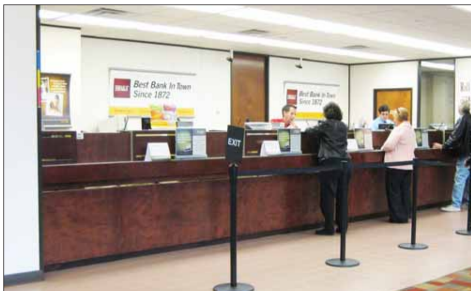
Sistemul bancar românesc va trece anul viitor printr-o perioadă de foc

„Anul viitor va avea loc o restructurare a rețelilor de dis-