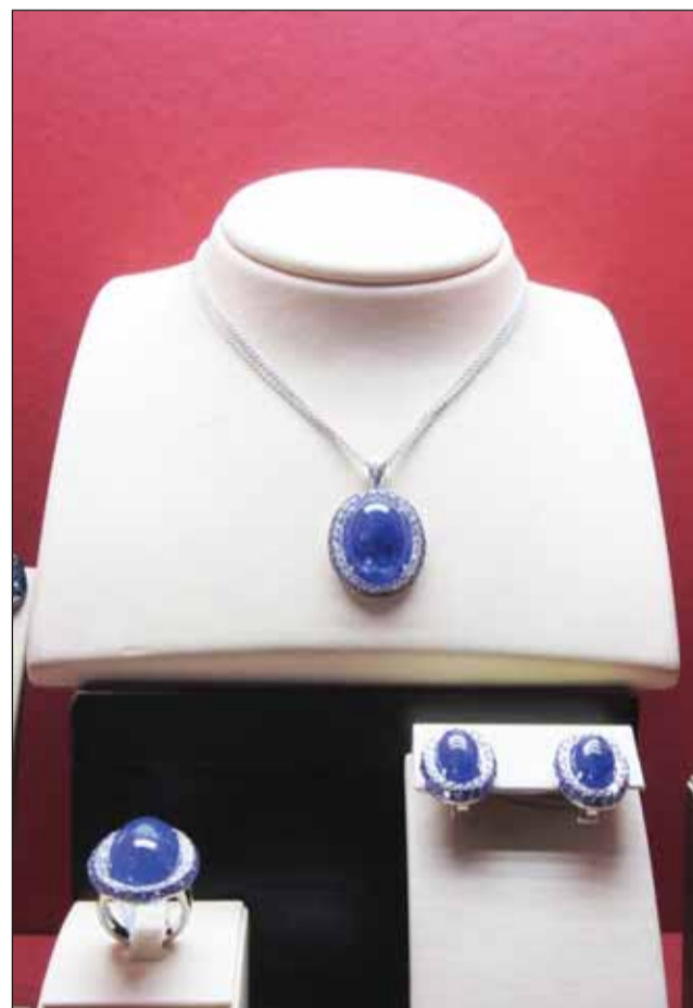
Vedeta colecției este un set format din colier, brățară și cercei în valoare de peste 150.000 de euro