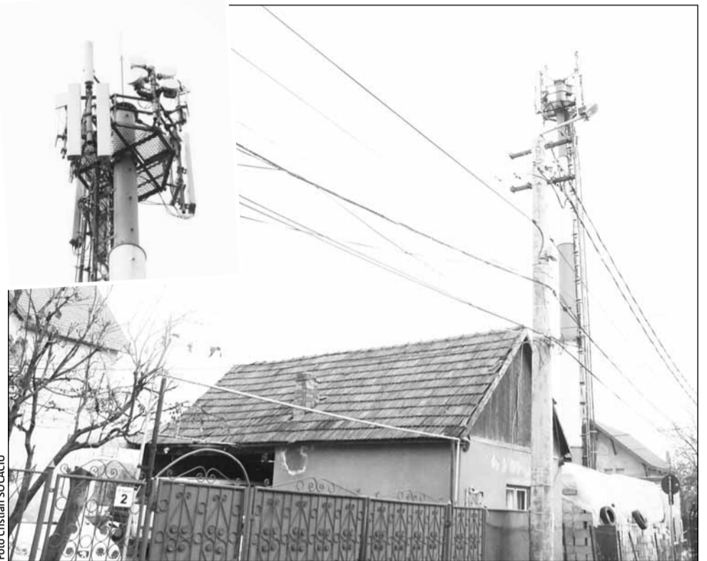
O stație cu 17 antene GSM de pe strada Copacilor din cartierul Someșeni dă dureri de cap locuitorilor

Oamenii au cerut și ajutorul deputatului independent Mircea Giurgiu care le-a promis că va depune o solicitare la Primăria Cluj-Napoca și la Ministerul Mediului și Pădurilor. „Memoriul întocmit de locatari va fi anexat unei întrebări pe care o voi depune la Ministerul Mediului prin care vom cere să constate sub ce formă