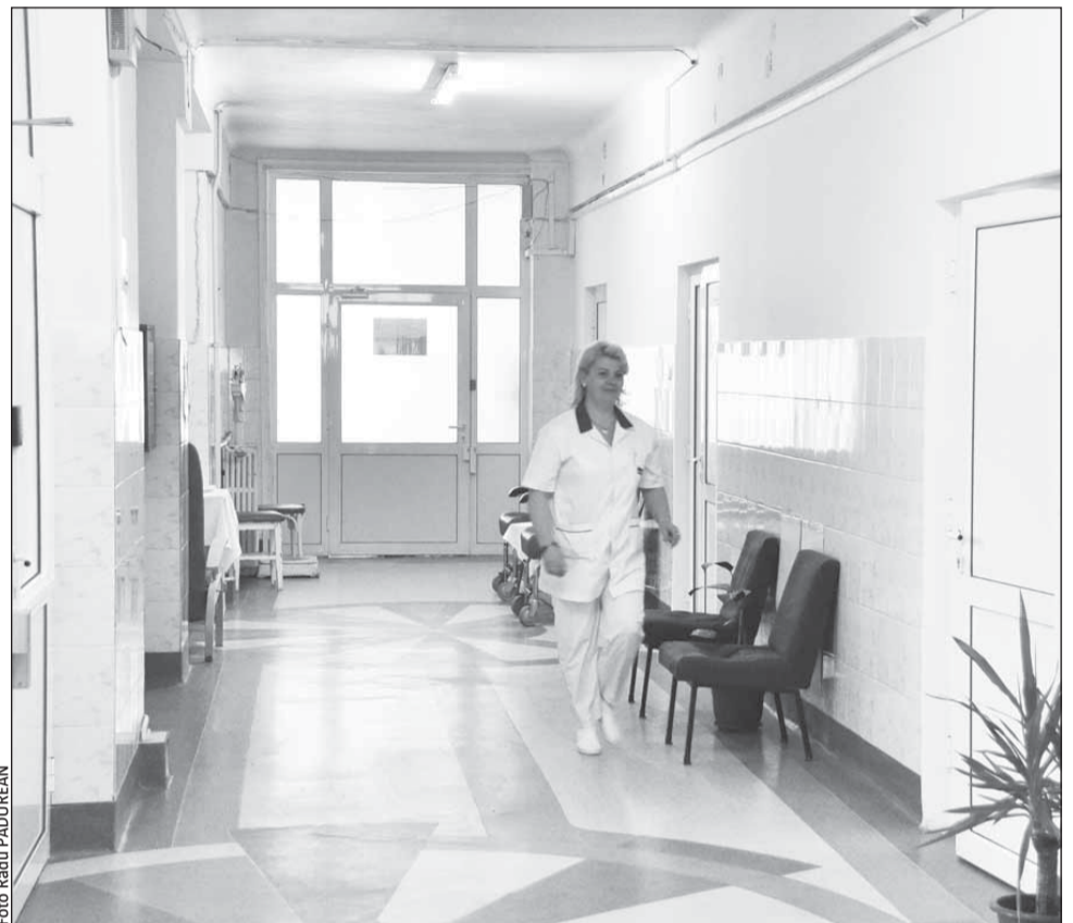
Spitalele din Cluj au bani pentru funcționare doar până în toamnă

Potrivit datelor furnizate de reprezentanții CAS Cluj, pentru unele servicii medi-